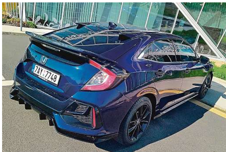
Výrazný spoiler dveří zavazadlového prostoru nepřehlédnete.