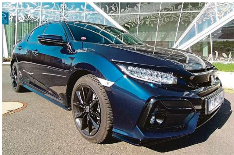
Civic 5D má hezkou novinku. Všimněte si aerodynamického prolisu dveří.