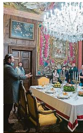
Na Konopišti MAFRA