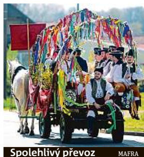
Spolehlivý převoz MAFRA