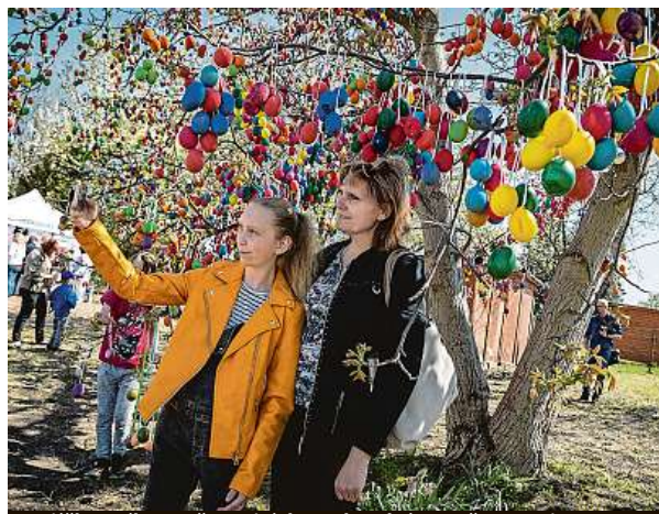
Vajíčkovník v Heřmanicích s rekordním počtem vajec

Ve Žďáru nad Sázavou zase oslavili největší křesťanský svátek pašijovými hrami pod otevřeným nebem. Kdo si pospíšil a včas poslal dopis nebo pohlednici na poštu do Kraslic, může se v následujících dnech těšit na zásilku ozdobenou mimořádným razítkem. PH