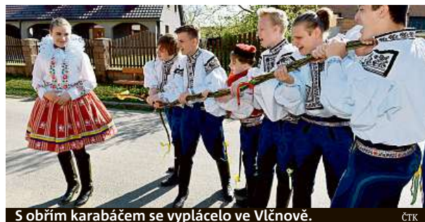
S obřím karabáčem se vyplácelo ve Vlčnově.