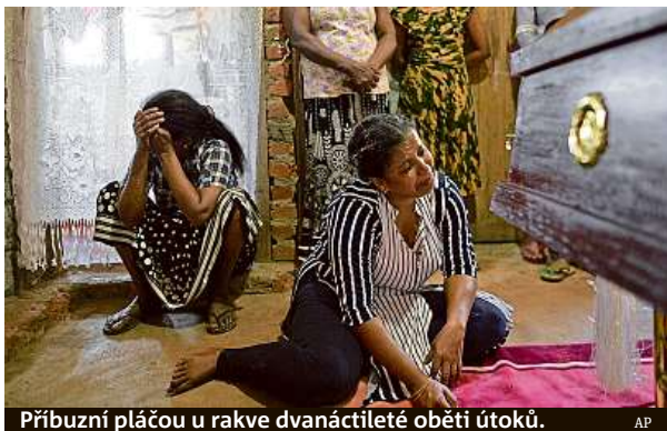
Příbuzní pláčou u rakve dvanáctileté oběti útoků.

Při útocích zemřelo o velikonoční neděli asi 300 lidí a dalších zhruba 500 bylo zraněno. Jde o nejhorší teroristický útok v dějinách Srí Lanky a jeho cílem byly kostely a hotely. Mezi mrtvými jsou i cizinci, včetně Evropanů. Češi mezi oběťmi podle dosavadních informací české diplomacie nejsou.