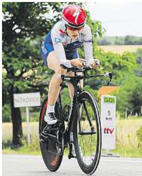
Martina Sáblíková

„Reprezentovat bude řada skvělých jmen, takže také očekávání budou velká,“ uve-