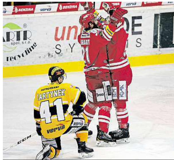
Radost Třince a Litvínov na kolenou, platilo po 6. duelu.

Fanoušci Litvínova, kteří se nevydají do Třince, můžou