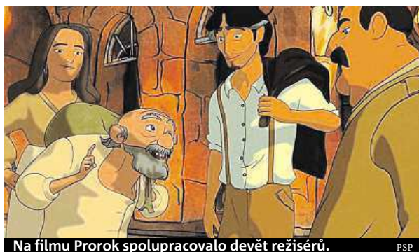
Na filmu Prorok spolupracovalo devět režisérů. PSP

V soutěži filmů pro dospělé zaujme adaptace slavné knihy Chalíla Džibrána Prorok,