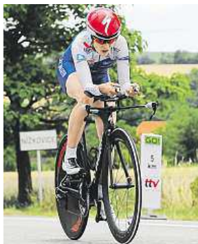
Martina Sáblíková

„Reprezentovat bude řada skvělých jmen, takže také očekávání budou velká,“ uve-