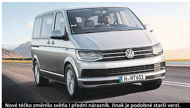
Nové téčko změnilo světa i přední nárazník. Jinak je podobné starší verzi.