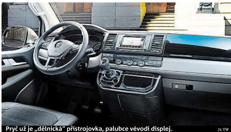
Pryč už je „dělnická“ přístrojovka, palubce vévodí displej.