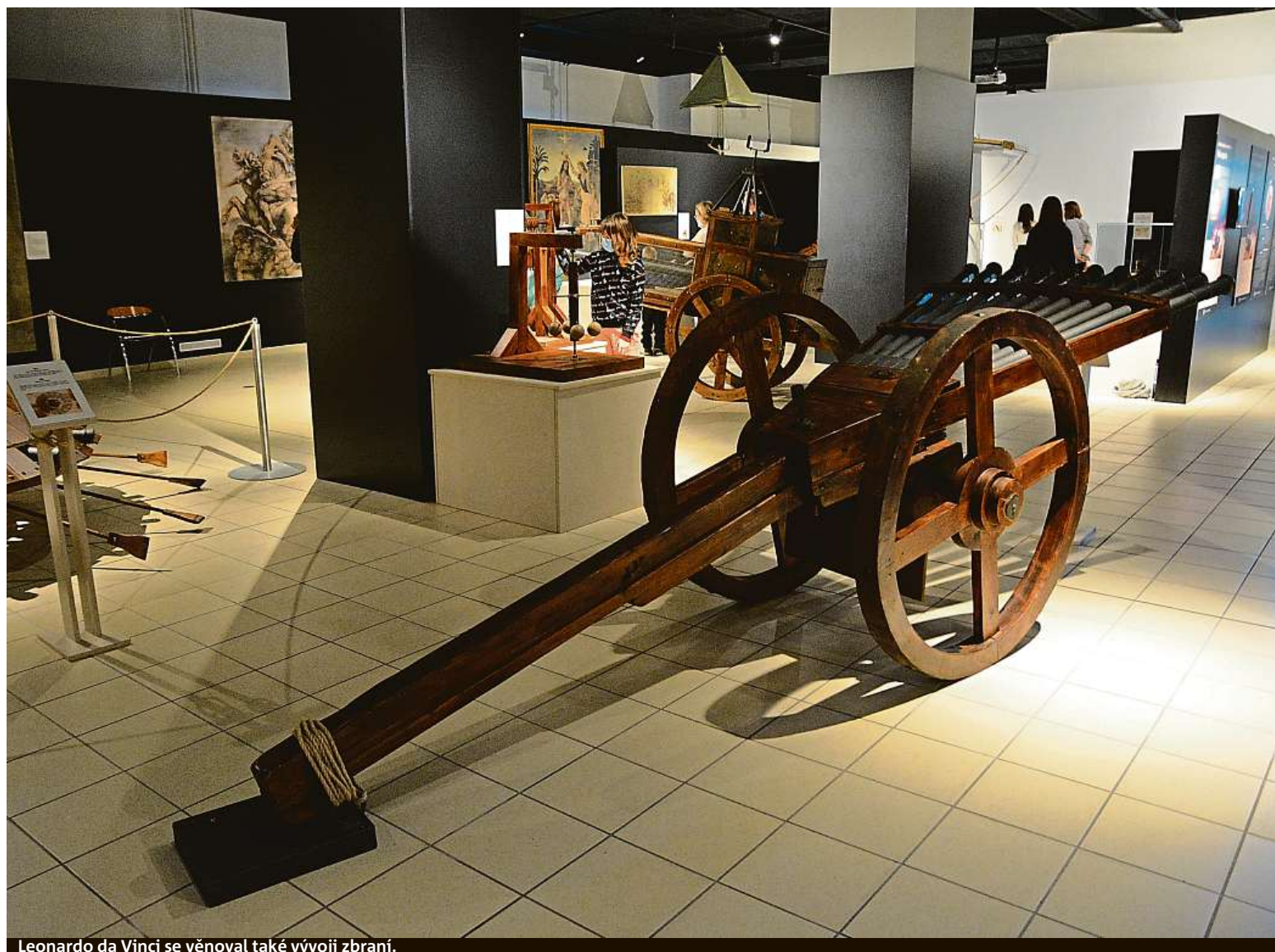
Leonardo da Vinci se věnoval také vývoji zbraní.