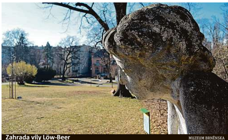
Zahrada vily Löw-Beer