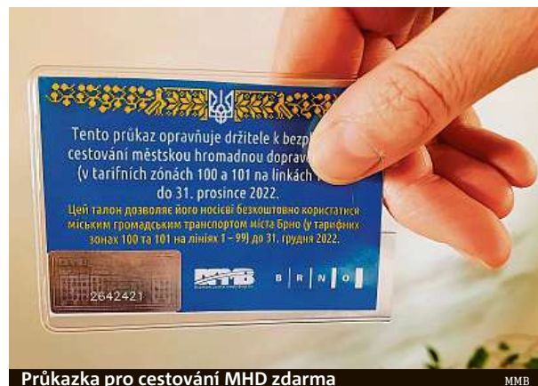
Průkazka pro cestování MHD zdarma

Svou podporu Ukrajině vyjadřují i brněnské veřejné a soukromé instituce.