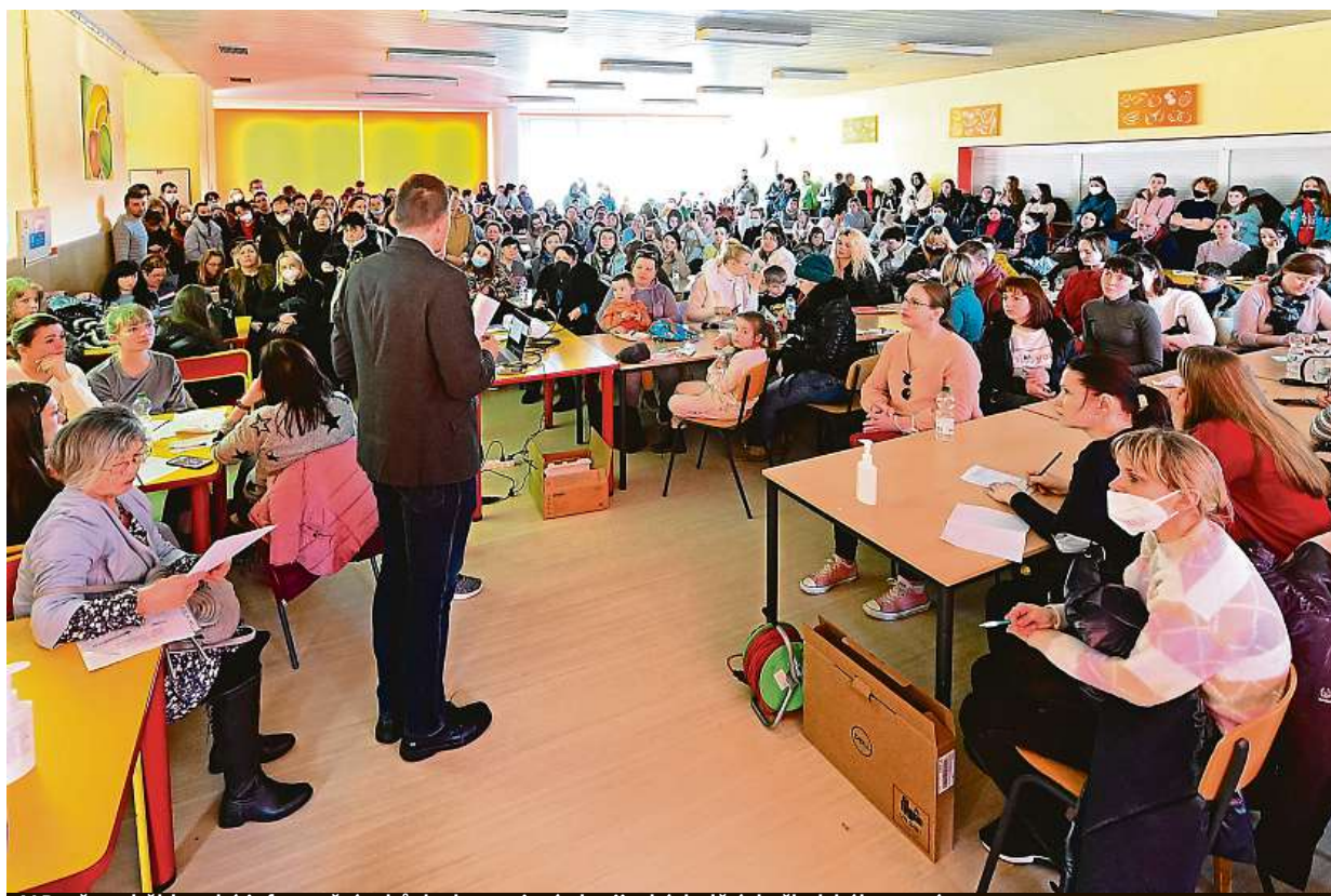
V Brně proběhla také informační schůzka k zapojení ukrajinských dětí do školského systému.