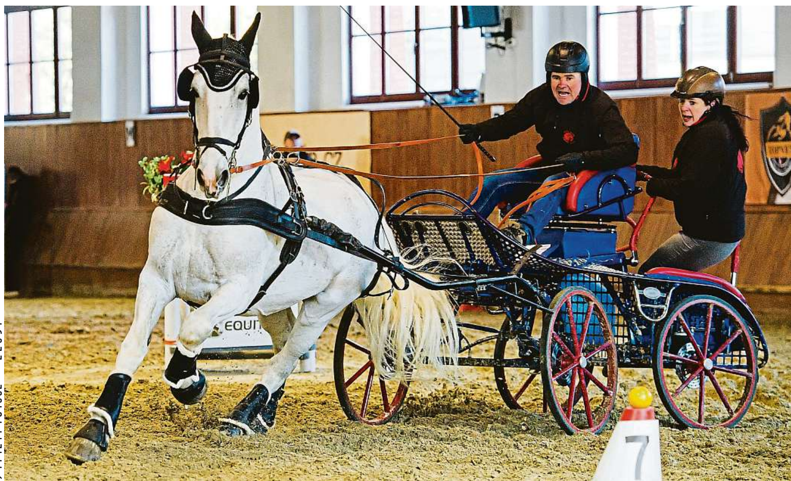
V hale Veterinární univerzity Brno se minulou sobotu konal osmý ročník Halových závodů spřežení. Určeny byly také pro kategorii hobby jezdců.

Způsoby pomoci. Ubytování, nábytková banka, MHD zdarma nebo vstup do institucí za symbolickou cenu. Střecha nad hlavou. Přes 250 Ukrajinců bydlí v hotelu Myslivna. Podpora. Na webu ukrajina.brno.cz STRANA 2