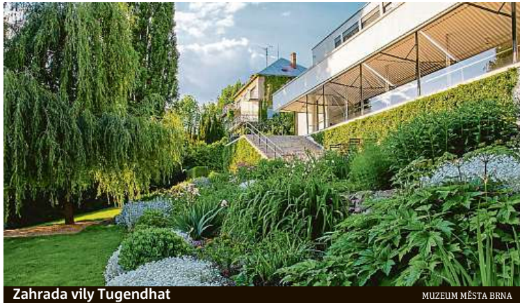
Zahrada vily Tugendhat