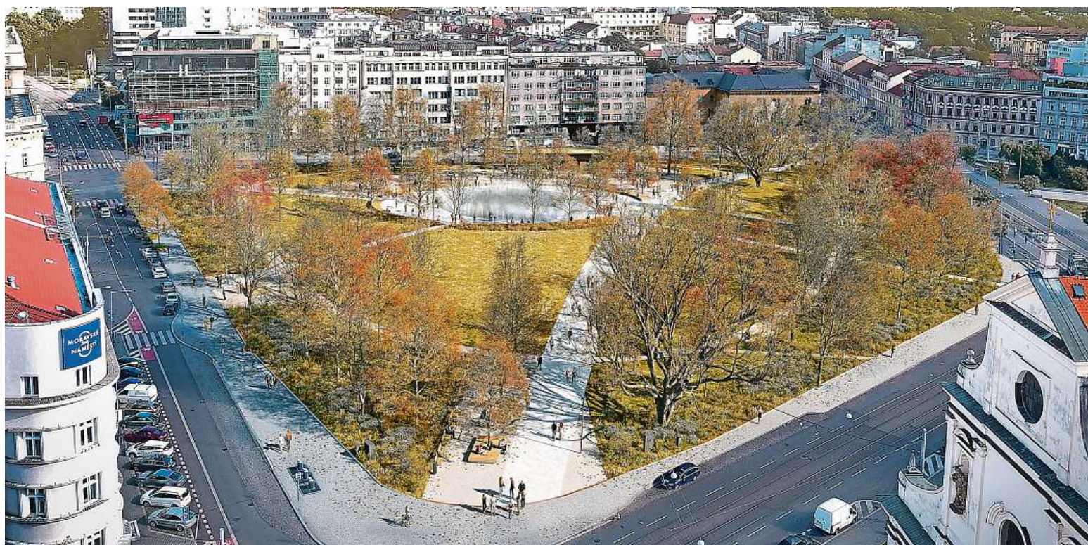
V parku přibude také mnoho stromů.