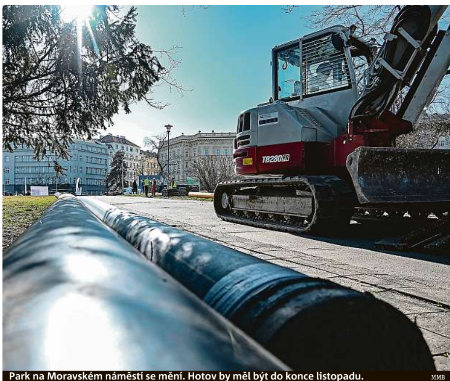
Park na Moravském náměstí se mění. Hotov by měl být do konce listopadu.