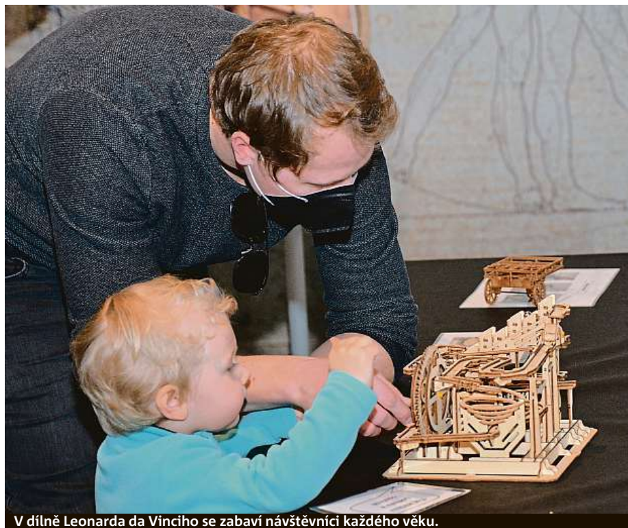
V dílně Leonarda da Vinciho se zabaví návštěvníci každého věku.