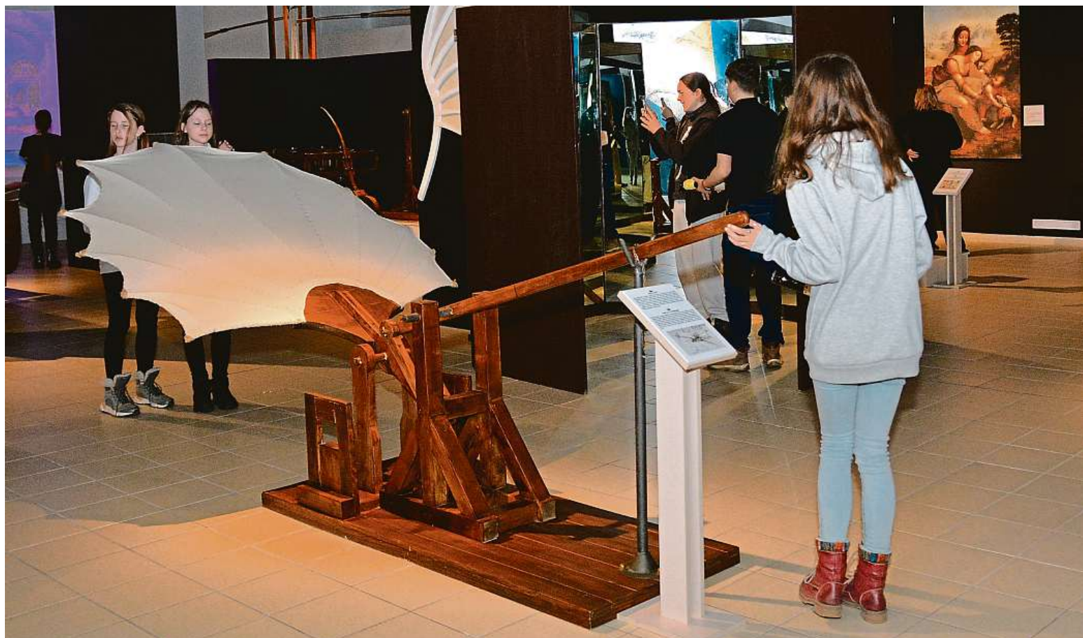
Leonarda da Vinciho vždy fascinovalo létání, v expozici nechybí jeho studie.