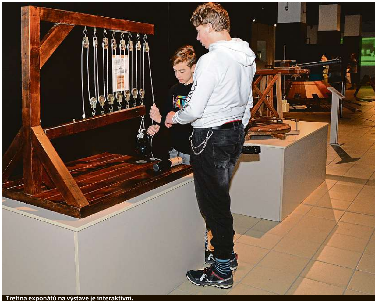
Třetina exponátů na výstavě je interaktivní.