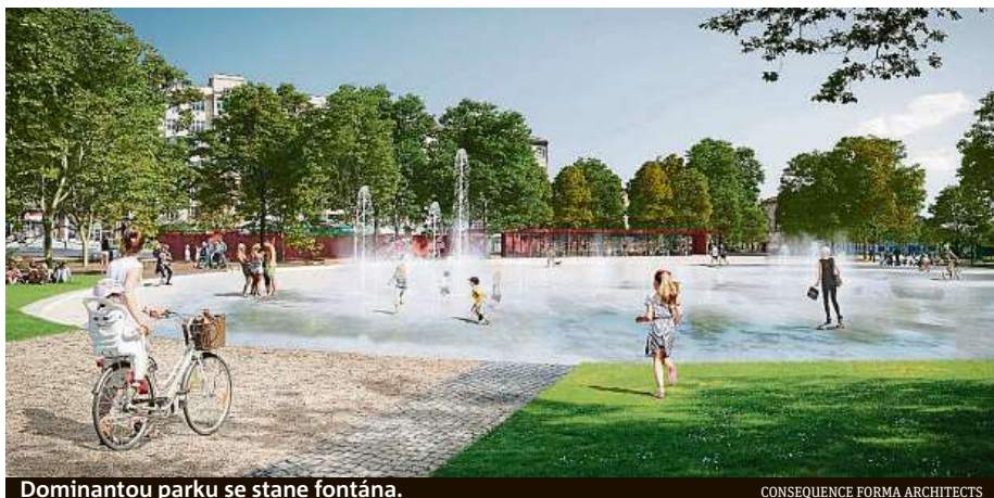
Dominantou parku se stane fontána.

V parku vznikne systém pro zadržování dešťové vody, která poslouží k zavlažování významné části zachovaných vzrostlých stromů a záhonů. Park obohatí také nemalé množství nových stromů, například javory, duby, jehličnany nebo dřezovce. Květinovou výzdobu pak budou tvořit bledule, ladoňky, sasanky, kosatce, divizny, pryšce nebo vrby. Rekonstrukce vyjde na 131 milionů korun, z toho 95,5 milionu poskytne město, zbývajících 35,5 milionu městská část Brno-střed. BAB