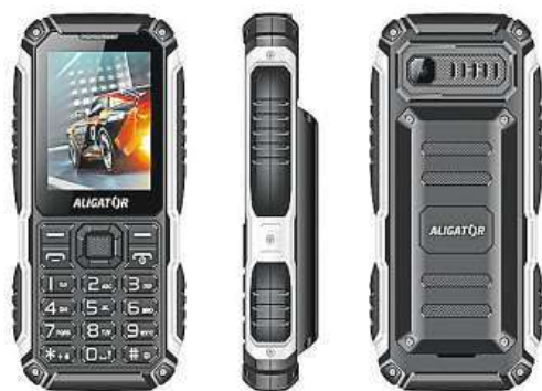
Nezničitelný Aligator dobře poslouží všude.

Právě teď by měli zbystrit všichni, kteří pracují v zaprášených prostorách nebo se ve volném čase rádi vydávají na dobrodružné výlety do míst, kde panují extrémní klimatické podmínky. Jestli k nim patříte, jistě sami víte, že ani v jednom z těchto případů nemůžete mít po kapsách běžný mobilní telefon. Jeho životnost se totiž v takovém prostředí výrazně snižuje. Bez telefonu se ale v jedenadvacátém století oběje jen málokdo, a tak přichází na řadu outdoorové telefony Aligator z všeříkající pro-