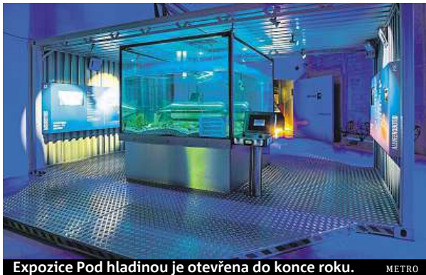
Expozice Pod hladinou je otevřena do konce roku. METRO

Věda je v celé Techmanii představována zábavným