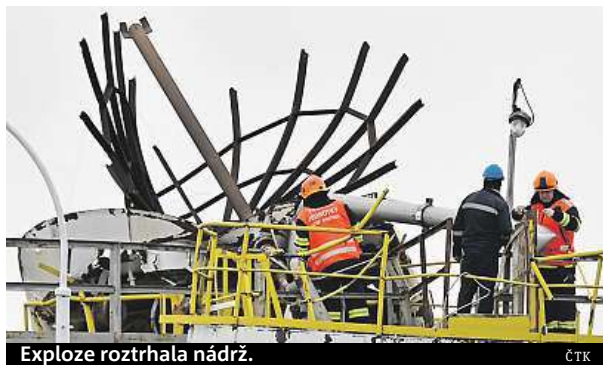
Exploze roztrhala nádrž.

Tragedie v kralupské chemičce mohla být ještě horší. V areálu se pohybovalo méně lidí než obvykle.