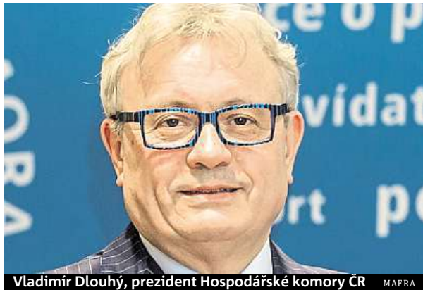
Vladimír Dlouhý, prezident Hospodářské komory ČR

kovat s velmi širokým spektrem partnerů. S vládou, se stranami, s odbory, s firmami. Velice mě to baví, protože mě vždy víc bavila konkrétní hospodářská politika. Nikdy jsem nebyl moc člověk politických stran a parlamentního života. Teď v parlamentu být nemusím, ale současně jsem velmi blízko