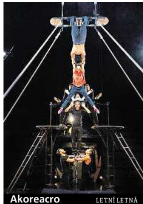
Akoreacro LETNÍ LETNÁ

Tradiční mezinárodní festival letos od 15. srpna do 2. září představí různé podoby nového cirkusu.