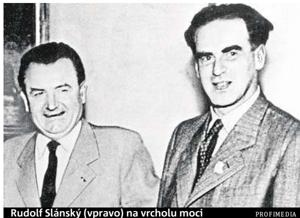
Rudolf Slánský (vpravo) na vrcholu moci