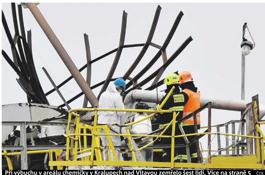
Při výbuchu v areálu chemičky v Kralupech nad Vltavou zemřelo šest lidí. Více na straně 5 ČTK

Vladimír Dlouhý. Prezident hospodářské komory v rozhovoru říká, že Česko neumí využít svůj potenciál ve vývoji počítačových her. V čem je problém. Dobré nápady raději prodáme, než zuzitkujeme doma STRANA 8