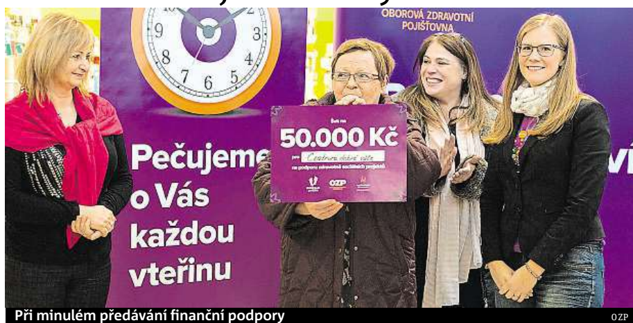
Při minulém předávání finanční podpory