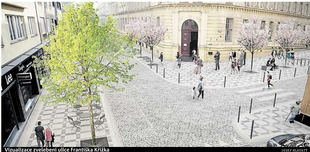
Vizualizace zvelebení ulice Františka Křížka