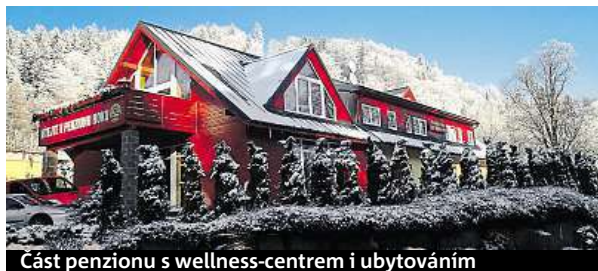
Část penzionu s wellness-centrem i ubytováním

kou jako rodinný penzion, zapojovali se pouze bratři a maminka, všechno se ale změnilo koupí třetího objektu a otevřením restaurace v roce 2008,“ zmiňuje.