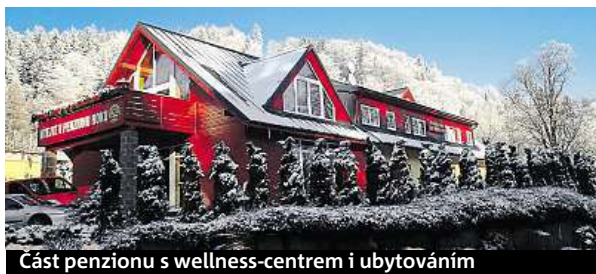
Část penzionu s wellness-centrem i ubytováním

kou jako rodinný penzion, zapojovali se pouze bratři a maminka, všechno se ale změnilo koupí třetího objektu a otevřením restaurace v roce 2008,“ zmiňuje.