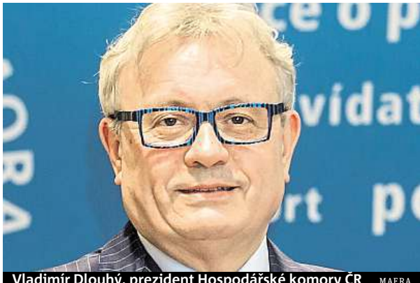
Vladimír Dlouhý, prezident Hospodářské komory ČR

Umíme své názory a pozice dobře formulovat, jsme jako celek silnější a důraznější. Více za své názory bojujeme. Úspěch je cennější o to, že komora má nepovinné členství a její fungování i financování není úplně jednoduché.