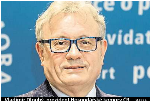
Vladimír Dlouhý, prezident Hospodářské komory ČR

Umíme své názory a pozice dobře formulovat, jsme jako celek silnější a důraznější. Více za své názory bojujeme. Úspěch je cennější o to, že komora má nepovinné členství a její fungování i financování není úplně jednoduché.