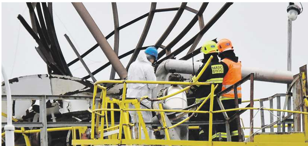
Při výbuchu v areálu chemičky v Kralupech nad Vltavou zemřelo šest lidí. Další dva lidé byli zraněni. Více na straně 2

Vladimír Dlouhý. Prezident hospodářské komory v rozhovoru říká, že Česko neumí využít svůj potenciál ve vývoji počítačových her. V čem je problém. Dobré nápady raději prodáme, než zužitkujeme doma STRANA 2