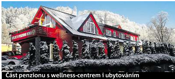
Část penzionu s wellness-centrem i ubytováním

kou jako rodinný penzion, zapojovali se pouze bratři a maminka, všechno se ale změnilo koupí třetího objektu a otevřením restaurace v roce 2008,“ zmiňuje.