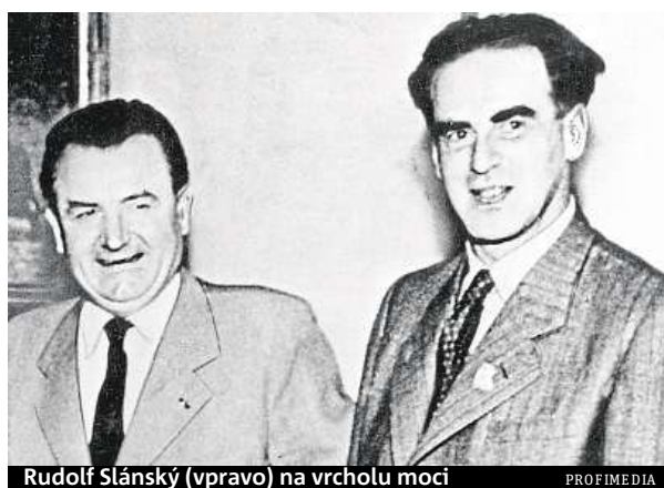
Rudolf Slánský (vpravo) na vrcholu moci