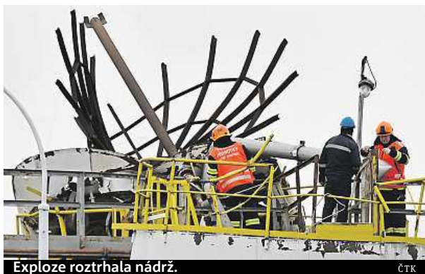
Exploze roztrhala nádrž.

Šest lidí zemřelo při včerejší explozi v chemičce v Kralupích nad Vltavou. Další dva utrpěli středně těžká zranění. Podle informací, které nemocnice včera odpoledne sdělila, nejsou sice v ohrožení života, ale je příliš brzy na nějaké prognózy. Oba jsou ve vážném stavu. Jeden ze zraněných utrpěl devastující poranění obličeje. Explozi předcházelo čištění prázdné nádrže na pohonné hmoty. Je to největší tragédie v tuzemských průmyslových objektech za poslední půlstoletí. Příčiny vyšetřuje policie. Nádrž, kterou několik lidí čistilo, vybuchla v 10 ráno. Původně bylo hlášeno šest zraněných, skutečnost ale byla mnohem tragičtější. „Bylo nalezeno šest mrtvých,“ infor-