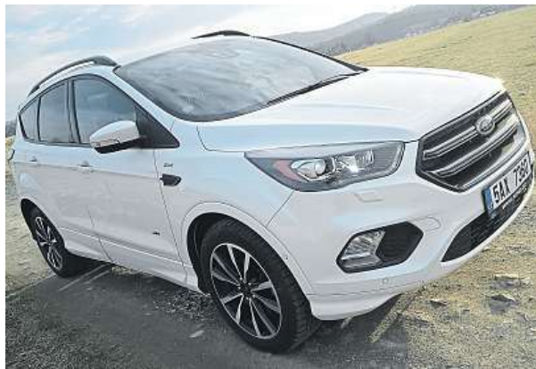
Nová kuga má elegantnější siluetu.