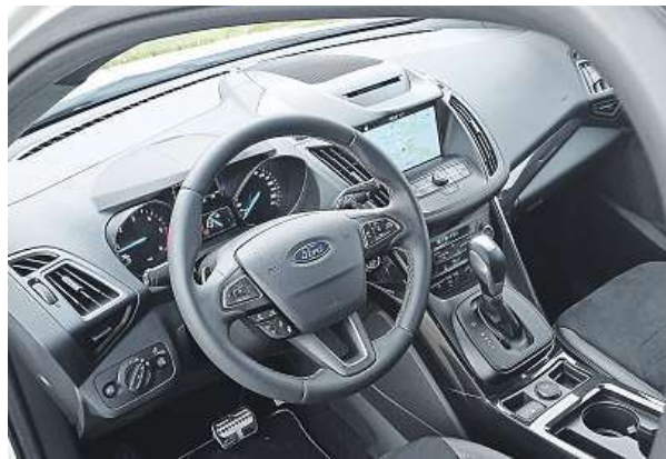
Multimediální systém Sync 3 už funguje, jak má.

Ford omladil svůj bestseller kuga. Vyzkoušeli jsme vyšperkovanou verzi ST-Line.