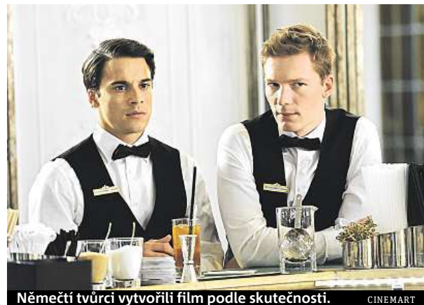
Němečtí tvůrci vytvořili film podle skutečnosti.

Saliya i přes svůj handicap postupně získává větší sebe-