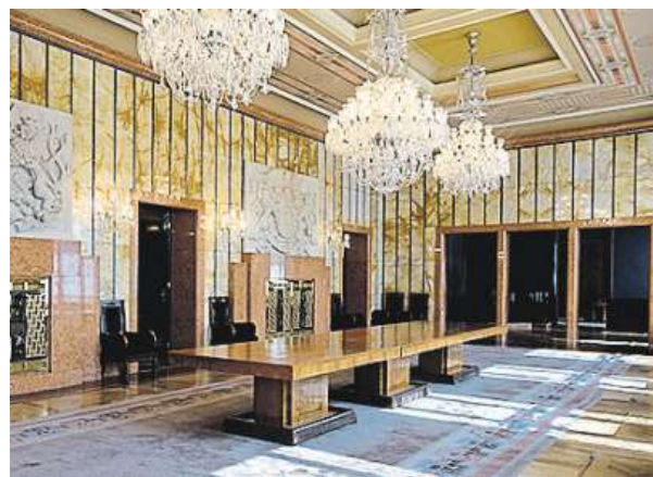
V interiéru se objevují dozvuky pozdní secese.

Rezidence primátora dnes slouží především k protokolárním a reprezentačním účelům. Navštívil ji například Bill Gates a mnoho dalších světoznámých osobností. Široké veřejnosti je zpřístupněna pouze v rámci dne otevřených dveří, tedy 28. října na výročí vzniku Československé republiky.