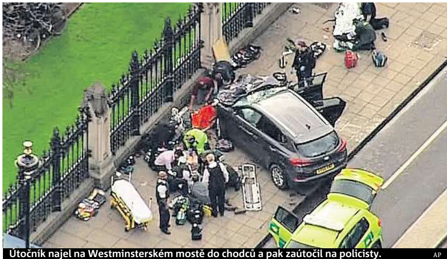
Útočník najel na Westminsterském mostě do chodců a pak zaútočil na policisty.

Policie vyšetřuje událost jako teroristický čin. ČTK, MET