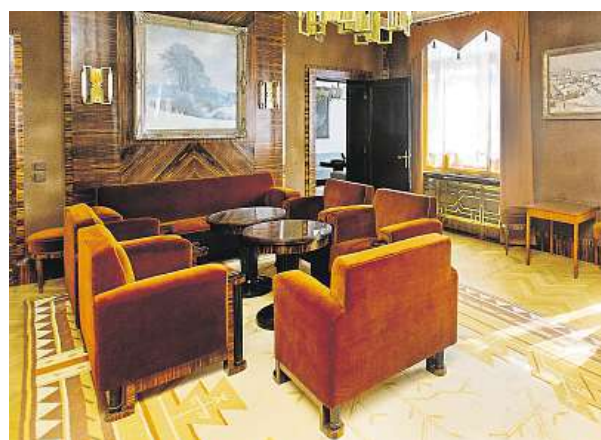
V letech 1994 – 1995 prošla generální obnovou.