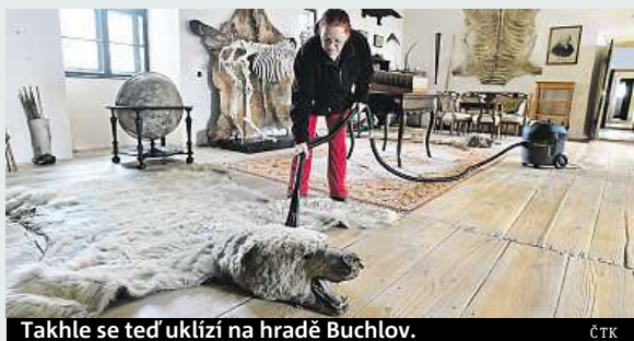
Takhle se teď uklízí na hradě Buchlov.