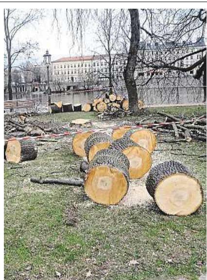
Káceno se opodstatně?