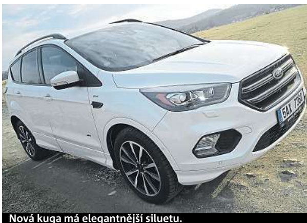
Nová kuga má elegantnější siluetu.