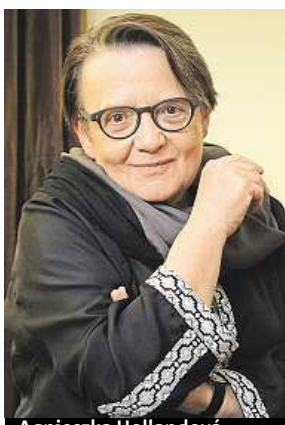
Agnieszka Hollandová

Pozvání na Febiofest přijal americký kultovní režisér Abel Ferrara, který na slavnostním zahájení převezme Kristiána za přínos světové kinematografii. Předsedou poroty bude legendární český režisér Juraj Herz.