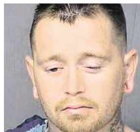
MARICOPA COUNTY SHERIFF'S OFFICE

zbraň, dvouletý hoch pistolí vzal a vystřelil. Kulka zasáhla devítiletého syna, který si hrál videohry.