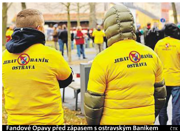
Fandové Opavy před zápasem s ostravským Baníkem