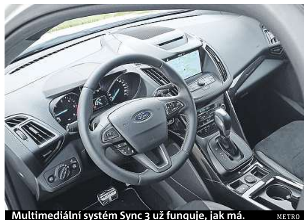
Multimediální systém Sync 3 už funguje, jak má.

A když už přece jen někdo od SUV vyžaduje i sportovní charakter, nebude ani v tomto případě zklamán. Zejména u námi testované verze ST-Line. Ta se nevyznačuje jen ztmavenými zadními lampami, černými rámečky oken a střešním spojlerem, ale také lehce sníženým a upraveným podvozkem – má silnější stabilizátory a tužší pouzdra zavěšení kol známé z focusu. Když přidáte nejsilnější motor z nabídky, dvoulitrový turbodiesel se 177 koňmi, máte postaráno o zábavu i s autem, od kterého byste to nečekali. Elektromagnetická vícelamelová spojka už není od Haldexu, ale od firmy JTeht a v případě potřeby posílá hnací sílu na obě nápravy