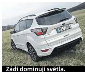
Zádi dominují světla.

Tomu autu nic nechybí. Větší kufr se 456 litry a dostatek prostoru na zadních sedadlech potěší rodiny. Řidičky, které mají rády na silnici přehled, zase ocení vysoký posez a dobrý výhled ven.