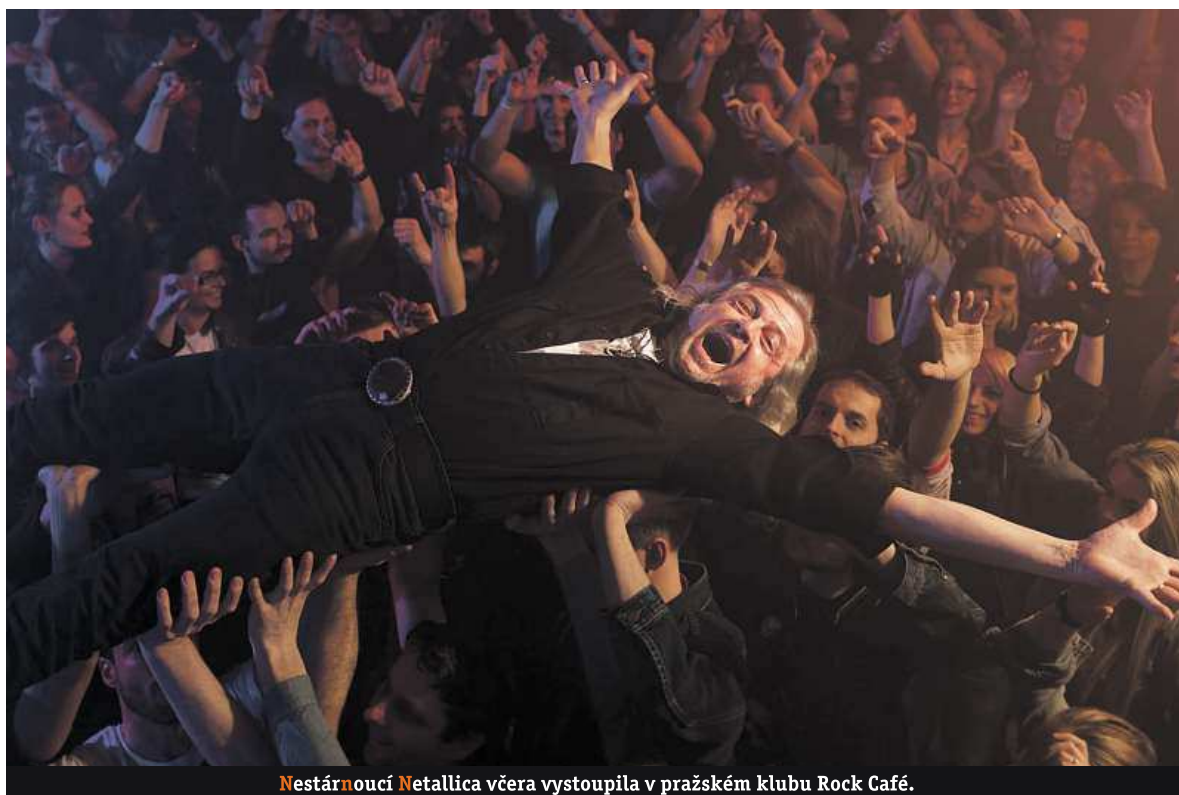
Nestárnoucí Metallica včera vystoupila v pražském klubu Rock Café.

Vyděšený lesník zavolal včera po poledni, že v Beskydech natrefil na medvěda, který se tam zřejmě dostal ze Slovenska, kde je jejich výskyt běžný. Po příjezdu nimroda se však celé nedorozumění vysvětlilo tím, že šlo pouze o řev bratří Nedvědů z blízké myslivny. Tentokrát to tedy dopadlo dobře, ale myslivci přesto preventivně vydali prohlášení, v němž nabádají turisty k obezřetnosti.