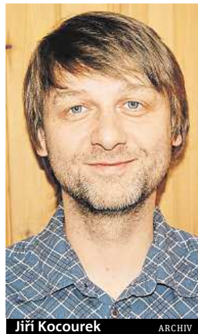
Jiří Kocourek ARCHIV

Už samotné dospívání může dát každému pořádně zabrat. Problémy jsou individuální. Například si čtrnáctiletý klient doma na PC prohlížel stránky s erotickým obsahem a během prohlížení mu vyskočila v prohlížeči stránka