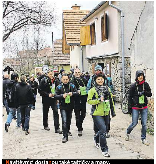
Návštěvníci dostanou také taštičky a mapy.