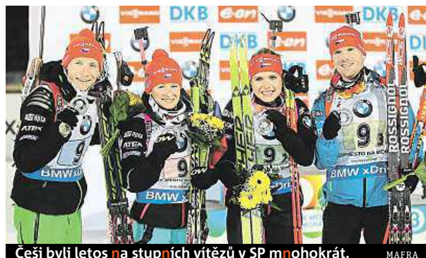
Češi byli letos na stupních vítězů v SP mnohokrát.

Mezi muži triumfoval ve Světovém poháru už počtvrté za sebou Francouz Martin Fourcade. Jistotu měl už po sobotním stíhacím závodě. Českým reprezentantům se v Chanty-Mansijsku příliš nedařilo. Jen Michal Šlesingr vybojoval umístění v první desítce ve stíhačce, kde byl devátý, ale v nedělním závodě s hromadným startem se propadl na 23. místo. Celkově byl v SP osmý, Ondřej Moravec dokonce šestý.