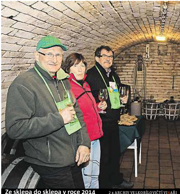
Ze sklepa do sklepa v roce 2014 2 x ARCHIV VELKOBÍLOVICÍ VINAŘI

„Vstupné zahrnuje nejenom neomezenou degustaci