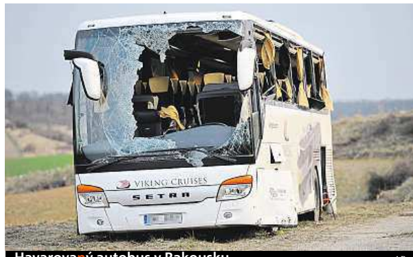
Havarovaný autobus v Rakousku

V autobuse bylo 17 lidí, z nichž třináct bylo zraněno, tři těžce a deset lehce. Mezi těžce zraněnými je i řidič autobusu, kterého museli vyprostit hasiči s pomocí hydraulického záchraného zařízení.