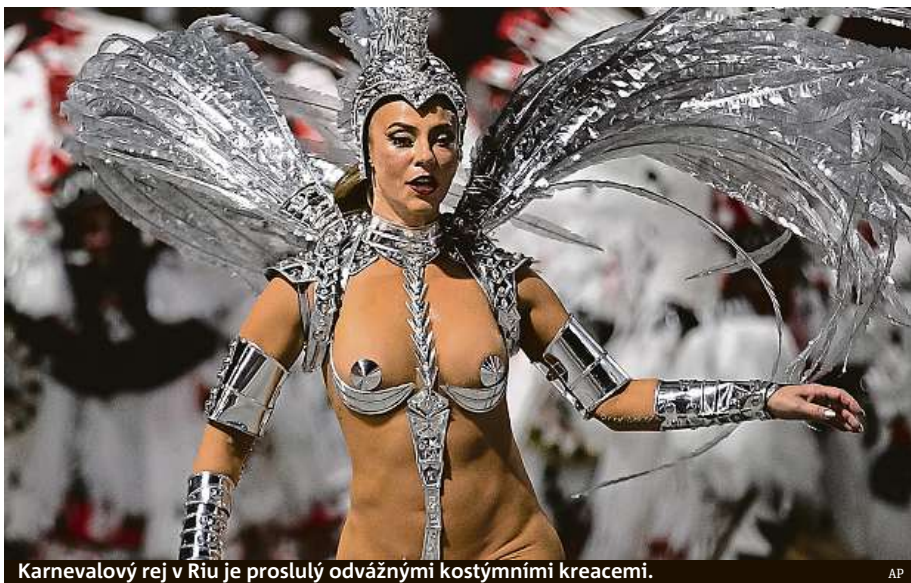
Karnevalový rej v Rio je proslulý odvážnými kostýmními kreacemi.

Největší podívaná se odehrává na stovky metrů dlouhé ulici s tribunami zvané sambodrom. Nejslovutnější