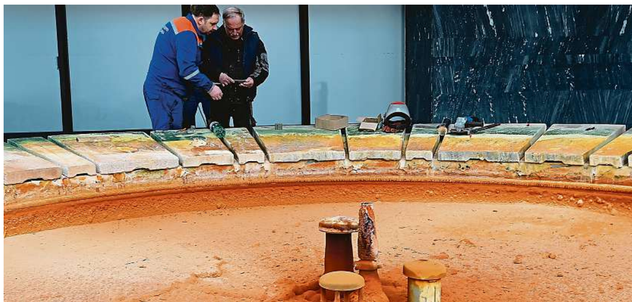
V Karlových Varech začala odstávka Vřidelní kolonády. Bazén je pokrytý vrstvou usazeného vřidlovce, ten se musí odstranit.

Matějská pouť. Letos potrvá od 25. února do 10. dubna. Ceny. Inflace i zdražování zvyšují poplatek na atrakce až o desítky korun. Lákadla. Airborne i Super Mouse. Změna. Opět se vstupuje od tramvají STRANA 3