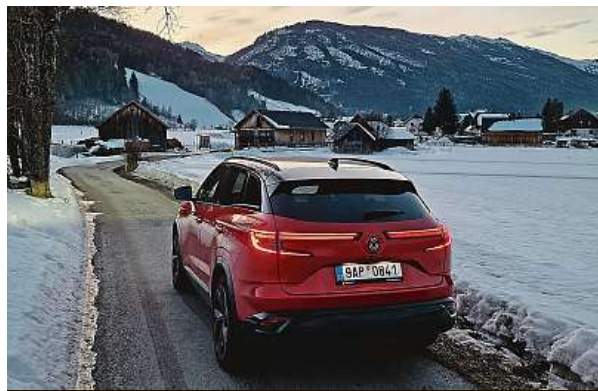
Maximální objem kufru je až 575 litrů.

Když jsme u těch rychlostí. Přes tisíc kilometrů dlouhou cestu zvládlo auto s průměrnou spotřebou 6,8 litru na sto kilometrů, což je solidní výkon. Nutno říct, že pomohla povinná stovka na většině úseků rakouských dálnic.