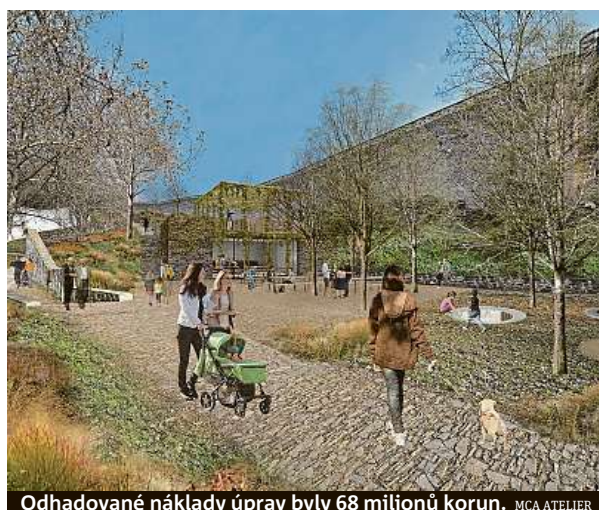
Odhadované náklady úprav byly 68 milionů korun.