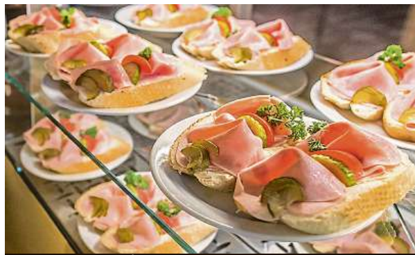
Nabídka chlebiček v pražském Národním divadle

Chlebiček z první scény národa českého rozhodně není zmenšeninou a vyjde v současnosti na padesát korun. I třetinka Plzně stojí šedesát korun, což odpovídá půllitru v restauracích v centru metropole. „Koncept občerstvení