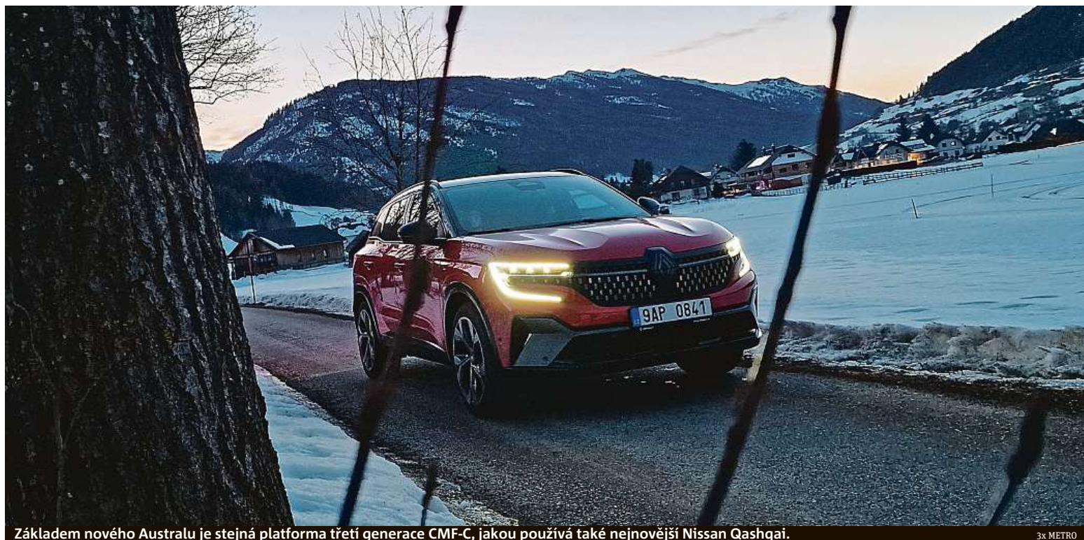
Základem nového Australu je stejná platforma třetí generace CMF-C, jakou používá také nejnovější Nissan Qashqai.