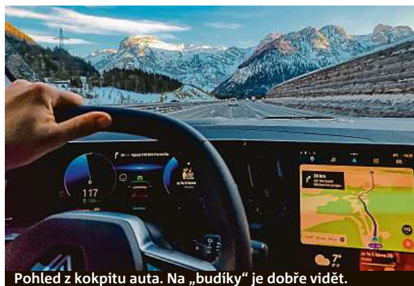
Pohled z kokpitu auta. Na „budíky“ je dobře vidět.

Motor spojený s mild-hybridním systémem a bezstupňovou převodovkou CVT fungoval bez chyb, snad vyjma několika zaváhání v kolonách, kdy se po vypnutí systémem start-stop trošku neohrabane vracel zpět k práci.