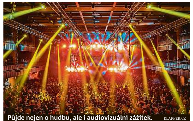
Půjde nejen o hudbu, ale i audiovizuální zážitek. KLAPPER.CZ

Na konci února proběhne drum & bassová akce v PVA Expo v pražských Letňanech.