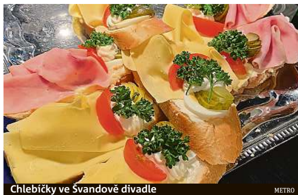
Chlebičky ve Švandově divadle