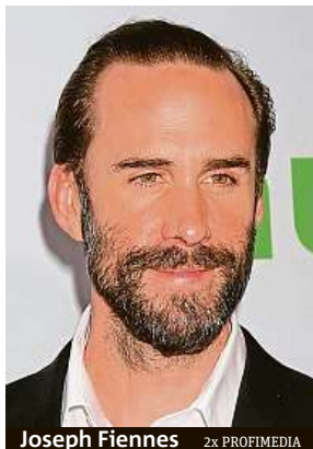
Joseph Fiennes

„Myslím, že to, co se odehrálo v anglickém týmu, bylo něco mimořádného. Teprve teď začínáme chápat Garethovu pozvolnou revoluci,“ uvedl Graham. Když Southgate převzal v roce 2016 reprezentaci, byl podle Grahama anglický tým na dně a hledal svou cestu. Nový kouč i s pomocí psycholožky mu pomáhal najít identitu a také popasovat se s dlouhodobě bídnou bilancí v penaltových rozstřelech. „To, co z toho dělá