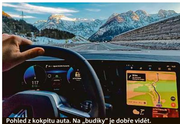
Pohled z kokpitu auta. Na „budíky“ je dobře vidět.

Motor spojený s mild-hybridním systémem a bezstupňovou převodovkou CVT fungoval bez chyb, snad vyjma několika zaváhání v kolonách, kdy se po vypnutí systémem start-stop trošku neohrabane vracel zpět k práci.