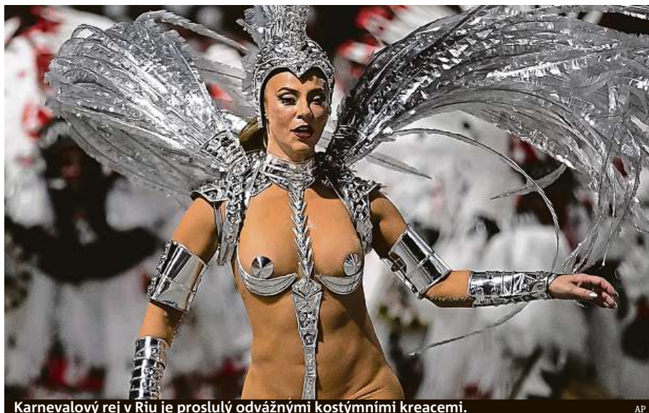
Karnevalový rej v Rio je proslulý odvážnými kostýmními kreacemi.

Největší podívaná se odehrává na stovky metrů dlouhé ulici s tribunami zvané sambodrom. Nejslovutnější