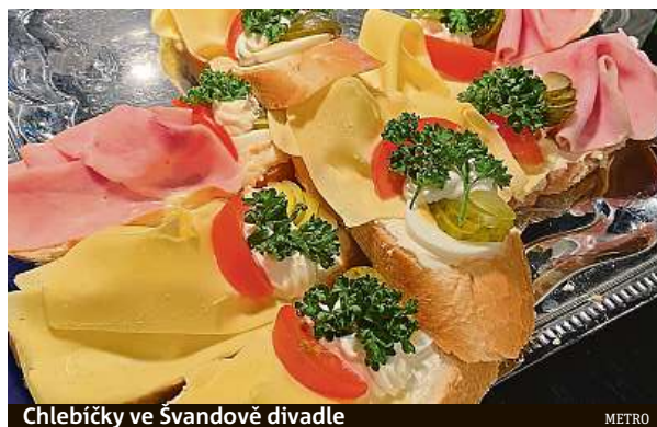
Chlebíčky ve Švandově divadle