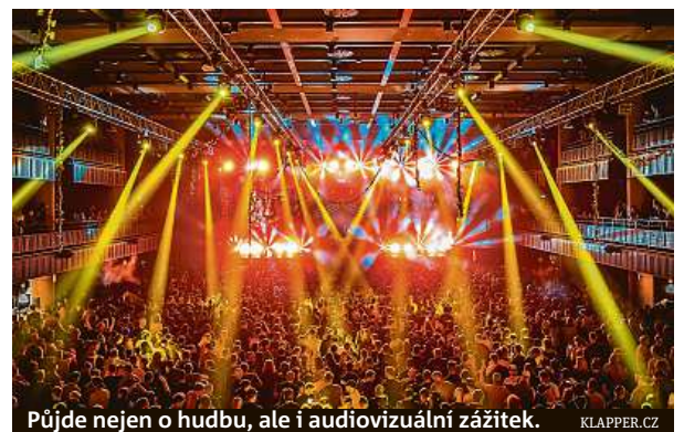
Půjde nejen o hudbu, ale i audiovizuální zážitek. KLAPPER.CZ

Na konci února proběhne drum & bassová akce v PVA Expo v pražských Letňanech.