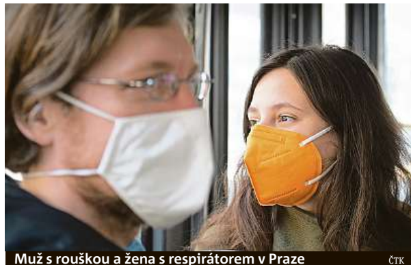
Muž s rouškou a žena s respirátorem v Praze

Stát také bude přes potravinové banky rozdávat roušky lidem v nouzi. Správa státních hmotných rezerv jim dodá 7,5 milionu ochranných pomůcek. Počítá se s balíčkem 50 roušek na jednu osobu. ČTK