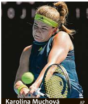
Karolína Muchová

Karolína Muchová si po semifinálové účasti na Australian Open polepšila ve světovém žebříčku o pět míst na dvaadvacátou pozici. Maximum čtyřadvacetileté české tenistky je o jednu příčku lepší. V čele nového pořadí WTA zůstala s velkým náskokem Australanka Ashleigh Bartyová, která na domácím grandslamu v Melbourne vypadla právě s Muchovou ve čtvrtfinále. Šampionka Australian Open Naomi Ósakaová je