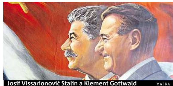
Josif Vissarionovič Stalin a Klement Gottwald

Komunisté se k „Vítěznému únoru“ stále hrdě hlásí