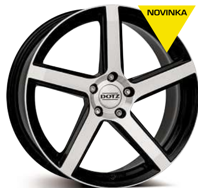
DOTZ CP5 dark