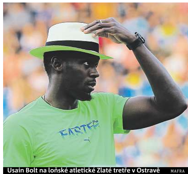
Usain Bolt na loňské atletické Zlaté třetě v Ostravě

Mimo jiné od tohoto kouče dostal jednadvacetiletý Bolt radu, že pro hrot má lepší dispozici. „Měl jsem v úmyslu