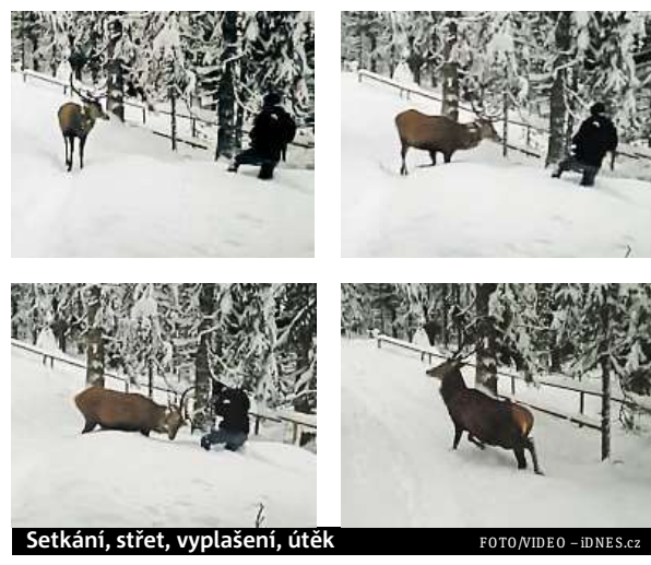
Setkání, střet, vyplašení, útěk