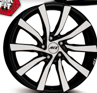
AEZ Reef & Reef SUV