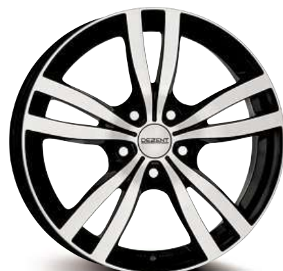
DEZENT TC dark