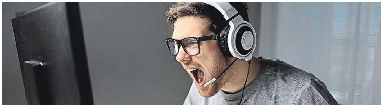
Počítače PC Mironet si navíc můžete přizpůsobit přesně podle vašich představ.

Fenoménu těžby kryptoměn stále neupadá, což s nelibostí nesou zejména hráči počítačových her. Těžáři bitcoinů a dalších měn totiž skupují výkonné grafické karty po desítkách i stovkách kusů, čímž z nich dělají kriticky nedostatkové zboží. Náš největší IT e-shop Mironet se rozhodl to nenechat jen tak a začal jednat. Na rozdíl od většiny prodejců, kteří rozebírají hotové sestavy, aby grafické karty prodali těžařům samostatně, Mironet vychází vstříc hráčům a nově naskladněné karty naopak do sestav přidává. Díky tomu omezuje jejich prodej těžařům, pro které už není pořízení celé sestavy tak výhodné, a zároveň je zpřístupňuje hráčům, kteří chtějí