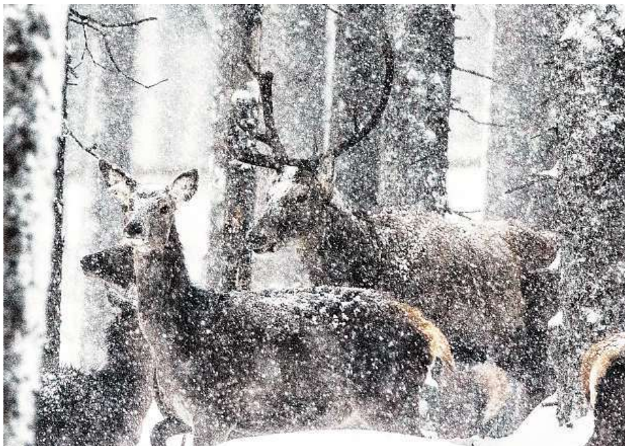
Jelen z Kvildy v hustém sněžení, jak ho loni v lednu zachytil fotograf MF DNES.