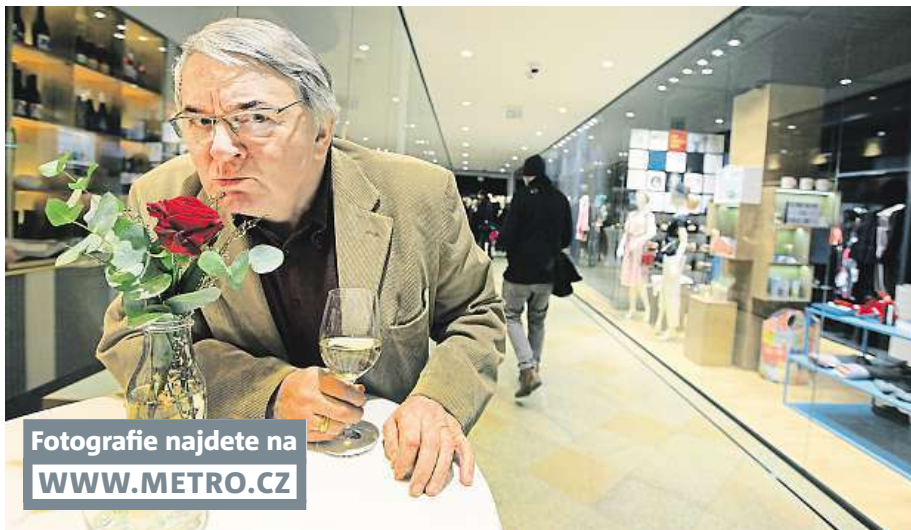
Fotografie najdete na WWW.METRO.CZ

Dříve byste mohli přejít suchou nohou téměř celé Václavské náměstí, dnes to ale jde pouze částečně. Mnoho pasáží bylo zneprůchodněno, přeměněno na obchodní plochy či úplně zrušeno. Ještě na přelomu století bychom v průchodech kolem náměstí napočítali