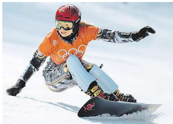
Ledeckou čeká závod na snowboardu zítra.

Ledecká šla ve Phoenix Parku také na procházku s maminkou Zuzanou.