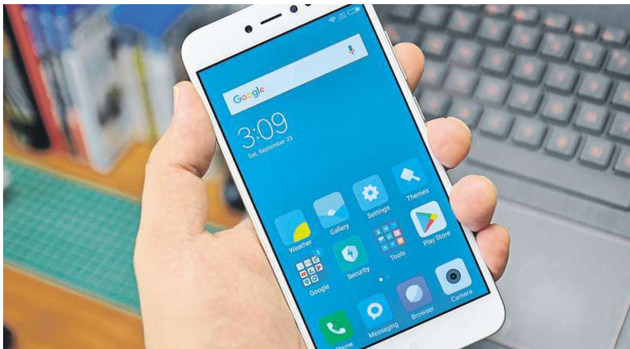
Telefon Xiaomi Redmi Note 5A nabízí pětapůlpalcový IPS displej.