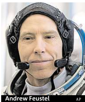
Andrew Feustel AP

Při své první vesmírné misi v roce 2009, jejímž cílem byla