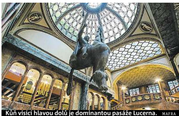
Kůň visící hlavou dolů je dominantou pasáže Lucerna.

Slavnostního otevření pasáže v Paláci Rosetto se zúčastnil i Vlastimil Harapes.