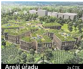
Areal úřadu