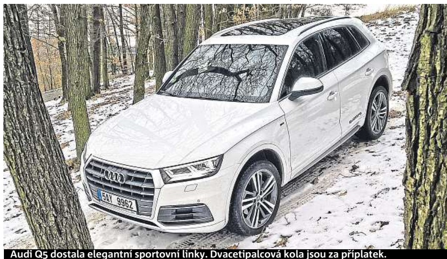
Audi Q5 dostala elegantní sportovní linky. Dvacetipalcová kola jsou za příplatek.