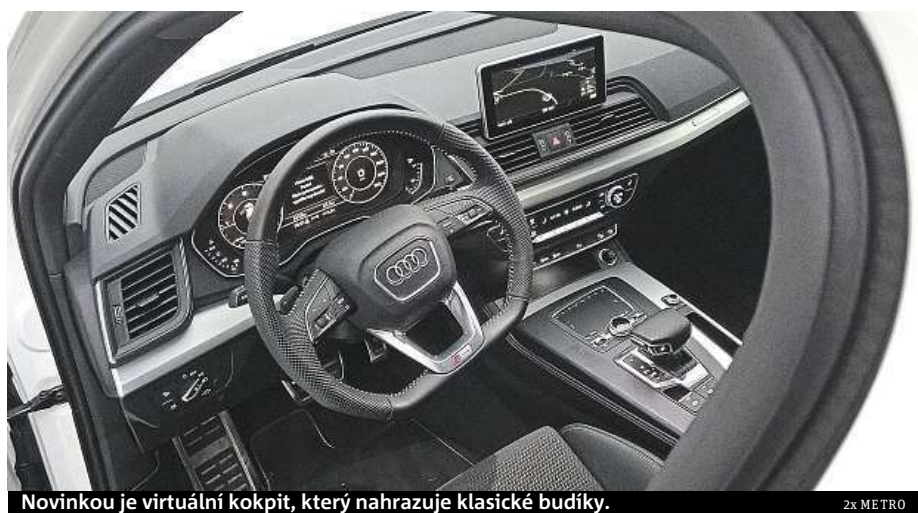
Novinkou je virtuální kokpit, který nahrazuje klasické budíky.