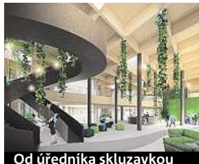
Od úředníka skluzavkou