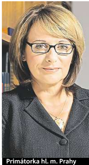
Primátorka hl. m. Prahy

Vztahovat se bude na všechny zaměstnance hlavního města Prahy zařazené do Magistrátu hlavního města Prahy a také je kladen důraz,