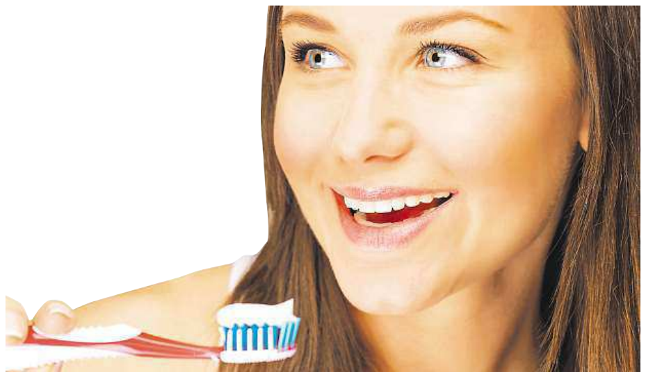
Základem zdravých zubů je prevence a pravidelné čištění.

Měli bychom se však zaměřit na materiál, který tvoří jeho štětiny. Přílišná měkkost ohrožuje kvalitu péče stejně jako opačný případ, tedy vlákna tvrdší. Poranění dásní mohou také způsobovat zubní kartáčky s ostrým zakončením štětín. Štětiny by v každém případě proto měly mít zaoblené konce.