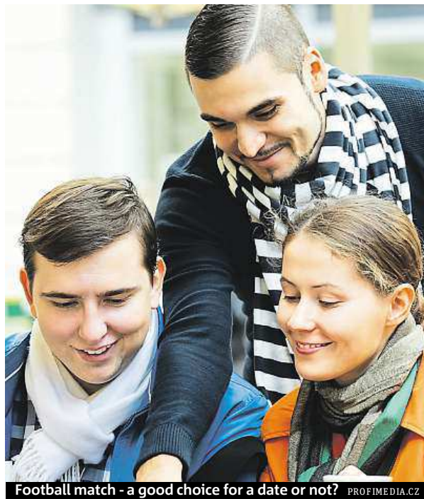
Football match - a good choice for a date or not?