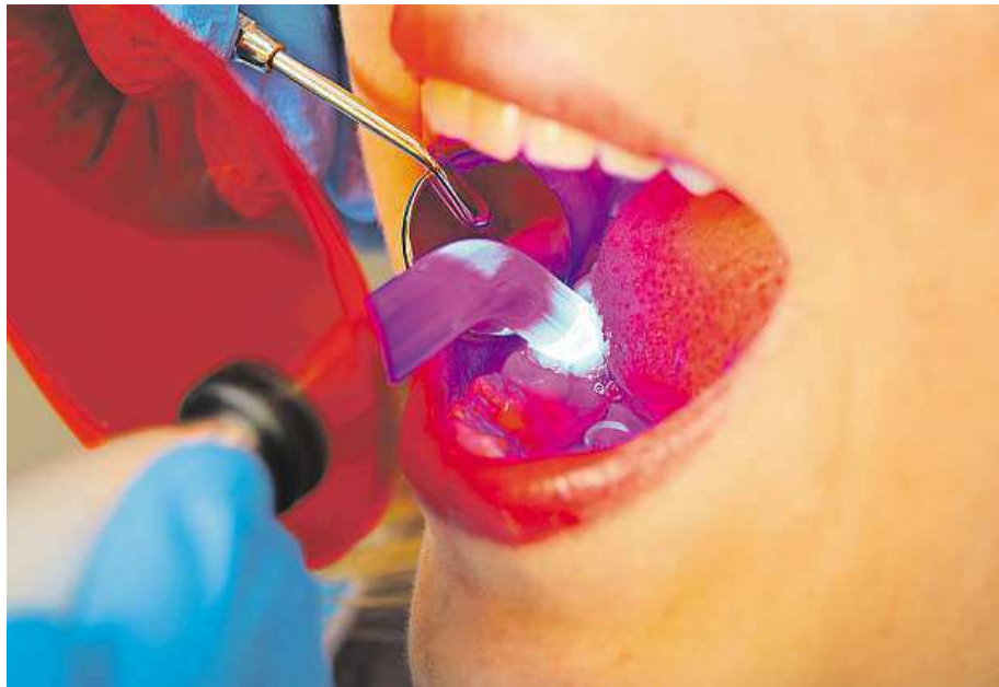
Nespornou výhodou světlem tuhajícího kompozitu je absence rtuti.

Dobře udělaná fotokompozitní výplň je náročná na čas i na zručnost a zkušenosti lékaře. Časové rozmezí na zhotovení výplně se pohybuje mezi 60–90 minutami. Vhod-