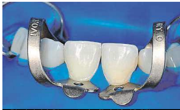
Bílé zubní výplně jsou nejen hezčí, ale i funkčnější.

„Velmi důležitá je příprava zubu, která při výměně nevhovující výplně či ošetření kazu zahrnuje dokonalé odvrátání poškozené tkáně a vyčištění od mikroorganismů. K tomu lékaři napomáhá detektor zubního kazu (caries marker), který barevně označí poškozenou zubní tkáň. Mikrobiální osídlení je minimalizováno pomocí dezinfekčních roztoků. Kvalitní zhotovení fo-