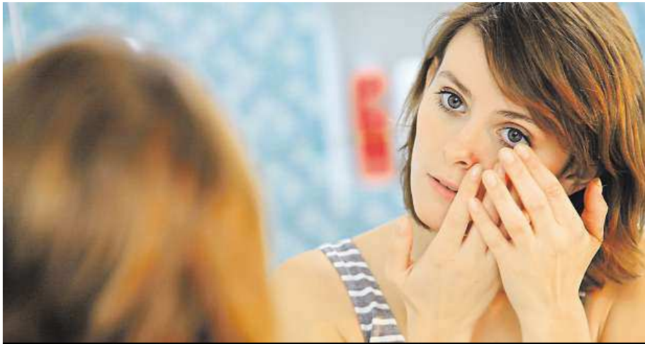
Je vhodné používat vždy jen kvalitní a správné kontaktní čočky.

Denně řešíme řadu povinností a potřebujeme vypadat a cítit se dobře. Stále více lidí proto používá pro korekci zrakové vady kontaktní čočky.