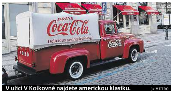
V ulici V Kolkovně najdete americkou klasiku.