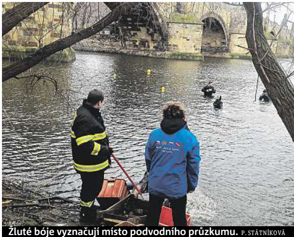
Žluté bóje vyznačují místo podvodního průzkumu. P. STÁTNÍKOVÁ

S potápěči se k základům v neděli vydal i Šefců. „Nejsem potápěč, ale nabídce podívat se na stavbu, kterou