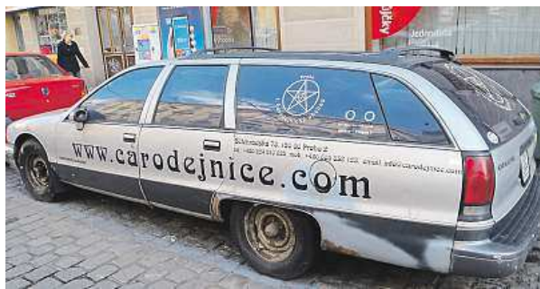
Parkovačku má kouzelné auto u Tylova náměstí do dubna.