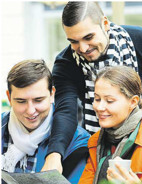
Football match - a good choice for a date or not?

you liked football ... Sarah: I don't! I hate it! Olivia: Who was playing? Sarah: I don't know ... one team in red, the other team in blue ... it was so boring! Olivia: Why did he take you there? Sarah: I don't know – the stupid thing is, he doesn't like football either! Olivia: I think I know why he took you ... Hello Fadi! Hello Johnny! Fadi/Johnny: Hi all! Olivia: Can I ask you two a question? Fadi: Sure ... Olivia: Was it your idea for Carlos to take Sarah to a football match? Fadi: Erm, er ... Johnny: It was Fadi's idea... Fadi: No it wasn't! It was your idea! Olivia: OK, OK, enough. Fadi: So, Sarah – did you have a good time? Sarah: Hmmmphhh. Johnny: I think that means no.