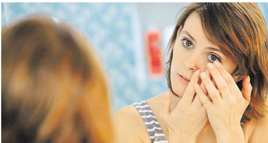
Je vhodné používat vždy jen kvalitní a správné kontaktní čočky.

Denně řešíme řadu povinností a potřebujeme vypadat a cítit se dobře. Stále více lidí proto používá pro korekci zrakové vady kontaktní čočky.