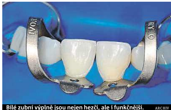
Bílé zubní výplně jsou nejen hezčí, ale i funkčnější.

„Velmi důležitá je příprava zubu, která při výměně nevhovující výplně či ošetření kazu zahrnuje dokonalé odvrátání poškozené tkáně a vyčištění od mikroorganismů. K tomu lékaři napomáhá detektor zubního kazu (caries marker), který barevně označí poškozenou zubní tkáň. Mikrobiální osídlení je minimalizováno pomocí dezinfekčních roztoků. Kvalitní zhotovení fo-