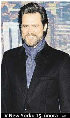
V New Yorku 15. února

Diváci přítomnost slavného komika, známého třeba z komedie Blbý a blbější či dramatu Věčný svit neposkvrněné mysli, zpochybňují v diskusích na internetu. V muži v úvodu slavnostního večera Carreyho nepoznali ani účastníci akce v sále. Pochybnosti vzbuzuje i srovnání sobotní podoby údajného herce s aktuálními fotkami