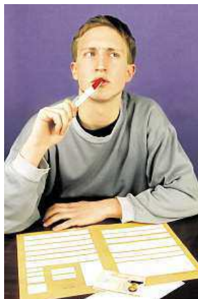
Hodně studentů se s přihláškami bude teprve prát.