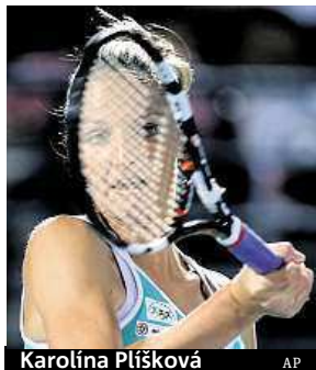
Karolína Plíšková

Výborný vstup do sezony prožívá česká tenistka Karolína Plíšková. Už dvakrát došla do finále, naposledy v Dubaji, kde podlehla Rumunce Simóně Halepové po setech 4:6, 6:7. Plíšková vydělala v přepočtu 5,5 milionu korun a může být velmi spokojená. Původně totiž na turnaji kategorie Premier 5 ani nechtěla hrát. „Zvažovala jsem, že si odpočinku a odhlásím se, nakonec je z toho finále,“ smála se. ČTK