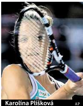
Karolína Plíšková AP

Výborný vstup do sezony prožívá česká tenistka Karolína Plíšková. Už dvakrát došla do finále, naposledy v Dubaji, kde podlehla Rumunce Simóně Halepové po setech 4:6, 6:7. Plíšková vydělala v přepočtu 5,5 milionu korun a může být velmi spokojená. Původně totiž na turnaji kategorie Premier 5 ani nechtěla hrát. „Zvažovala jsem, že si odpočinu a odhlásím se. A nakonec je z toho finále,“ smála se rodačka z Loun. ČTK