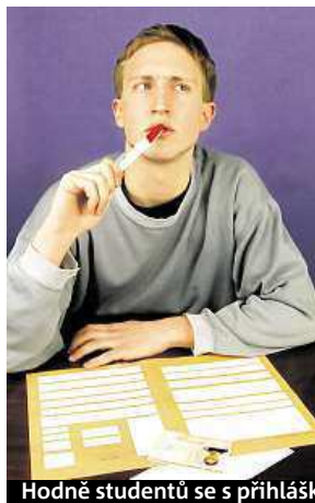
Hodně studentů se s přihláškami bude teprve prát.