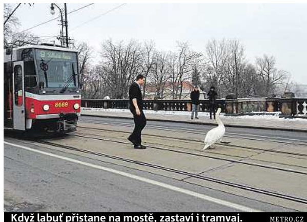
Když labuť přistane na mostě, zastaví i tramvaj. METRO.CZ

Zatímco v roce 2013 se podle statistik Záchranáre stane hlavním města Prahy zranilo zhruba třicet labutí, následující rok už jich bylo o dvacet víc. Za nepříznivý nárust může podle ornitologů vyšší koncentrace ptáků kolem mostů v posledních měsících. „Labutě do Prahy létají