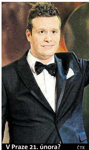
V Praze 21. února?