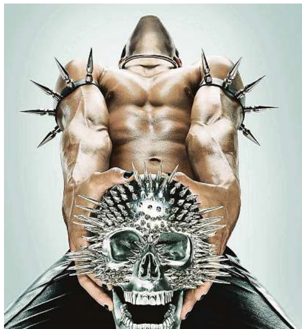
Série American Horror Story je úspěšná značka.

I přes kolísavou kvalitu posledních řad považuji American Horror Story za seriál s velkým S. I proto jsem se těšil na to, až budou na Disney+