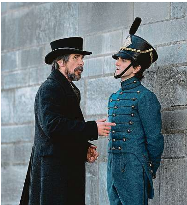
Christian Bale (vlevo) a Harry Melling

Dobovka Bledé modré oko, jejíž děj je zasazen do Spojených států první poloviny devatenáctého století, měla být právě tím atmosférickým snímkem, který rádně nakopne letošní netflixovskou sezonu. A vlastně se to před pár dny i povedlo. Pro kritičtější smýšlející diváky ale šlo o jedno ze zklamání, která se rok co rok kupí na nejoblíbenější tuzemské platformě stále víc. Bledé modré oko určitě nejde z fleku odpálit jako špatný