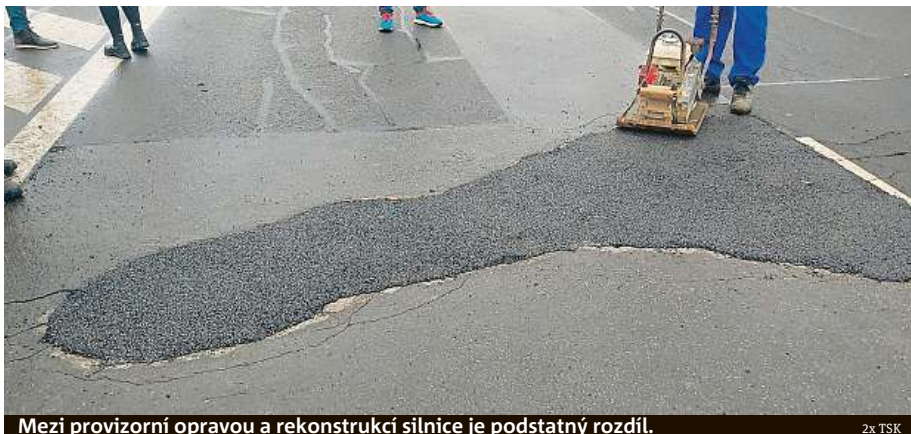
Mezi provizorní opravou a rekonstrukcí silnice je podstatný rozdíl.

„Práce nám na chvíli přerušilo až víkendové snížení. Průměrně jsme do té doby během ledna dělali každý den pět set oprav, a to včetně víkendů. Toto číslo pochopitelně stále roste. Rekordním dnem, kdy se nám podařilo opravit nejvíce výtluků, byl 7. leden, kdy číslo vyšplhalo až na počet 1197,“ dodává pro deník Metro Lišková, podle které budou dělníci v následujících dnech postupně