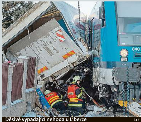
Děsivě vypadající nehoda u Liberce

V Lovětíně, Řídelově nebo Lhotce na Jihlavsku mají už řadu let každoroční zimní atrakci díky nadšeným jednotlivcům vytvářejícím ledové skulptury. Jedním z nich je Alois Procházka, který vytváří obří ledové květiny stříkáním vody na keře v místě obecního tábořiště u obce Lhotka už asi deset let. Řeší tím i problém se zamrznáním vody v potrubí v době, kdy ji tábořiště nečerpá. Ledové výtvořky lákají řadu turistů. Podobné ledové atrakce vysoké okolo pěti metrů nabízí i Lovětín, kde je zdrojem vody starý vodovod už řadu let nevyužívaný. Vyhledávanou turistickou atrakcí byla v minulosti obdobná ledová krása v obci Hybrálec, kde ji tvůrce pro větší efekt navesílil. čTK