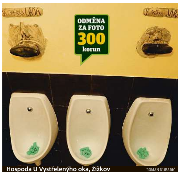
Hospoda U Vystřeleného oka, Žižkov