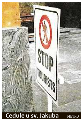
Cedule u sv. Jakuba METRO

„Tu ceduli sem umísťujeme pouze v době, kdy probíhá bohoslužba. U vchodu je tak