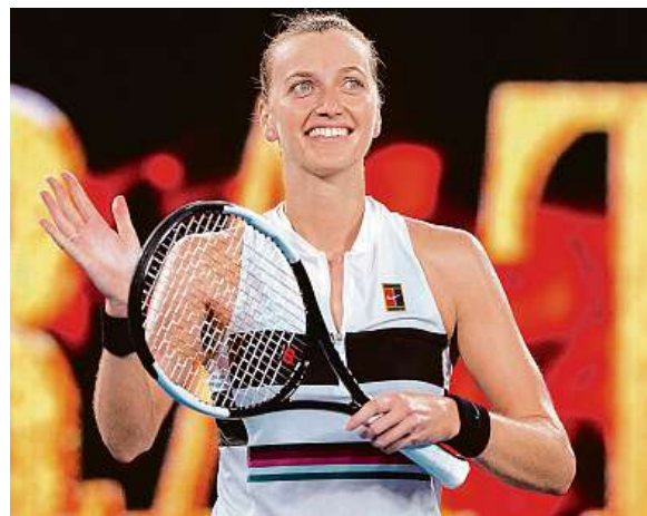
Petra Kvitová sklídila ovoce zaplněného centrkurtu.

V repríze nedávného finále turnaje v Sydney Kvitová v úvodním setu naprosto dominovala a získala ho za 28 minut. „Začala jsem rozhodně lépe než ve finále v Sydney,“ připomněla Kvitová, že v Sydney úvodní set prohrála 1:6. Druhá sada byla výrazně vyrovnanější. Bartyová byla suverénní při