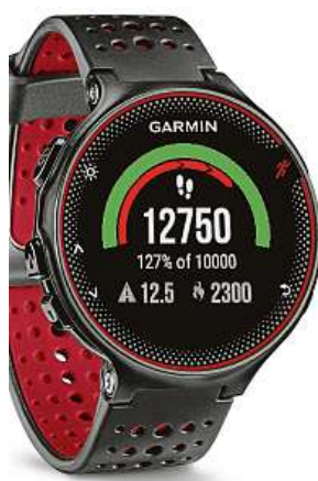
Síkovný pomocník 2xMIRONET

Jak vám chytrá nositelná elektronika může pomoci k lepším sportovním výkonům? Praxe ukazuje, že chytré příslušenství skutečně dokáže motivovat uživatele, dokáže změřit jeho úspěchy a také je vizualizovat. Jedním z nejoblíbenějších nositelných doplňků jsou sportovní chytré hodinky.