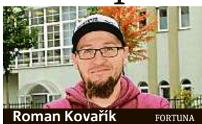
Roman Kovařík FORTUNA

Japonský tenista se letos potkal s výtečnou formou, ale v Melbourne má za sebou už dost těžké zápasy, které jej stály množství sil. Třikrát o postup musel bojovat v pěti setech. Vzájemná bilance světové devítce rovněž nepřije, s Djokovičem poměřil Nišikori síly už sedmákrát a zvítězil