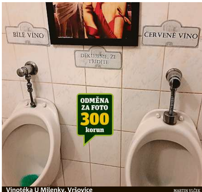
Vinotéka U Milenky, Vršovice

Na neobvyklé toalety narážejí čtenáři Metro docela často. K takovému závěru jsme v redakci došli poté, co jsme si prohlédli desítky čtenářských fotografií, které nám na toto téma zaslali. Fotografické výzvy se tentokrát chopili tak poctivě, že k nám dorazily nejen obrázky pořízené v tuzemsku, ale i v zahraničí. Protože jsme však ve výzvě přislíbili otisknout a odměnit nejzajímavější snímky toalet, které byly pořízeny ve vašem okolí, těmi zahraničními se můžete pokochat alespoň na našem webu www.metro.cz . MET