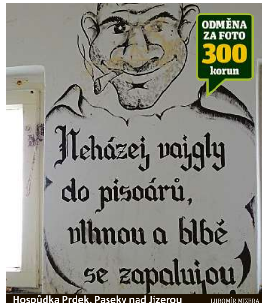
Hospůdka Prdek, Paseky nad Jizerou