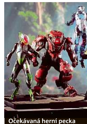
Očekávaná herní pecka

Standardní edici hry Anthem v Mironetu poříďte za 1399 korun pro PC a za 1599 korun pro konzole. Speciální edice Anthem Legion of Dawn Edition pak může být vaše za 2199 korun. Oficiální vydání hry nastane 22. února.