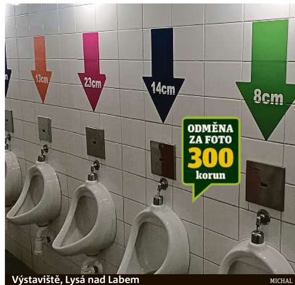
Výstaviště, Lysá nad Labem