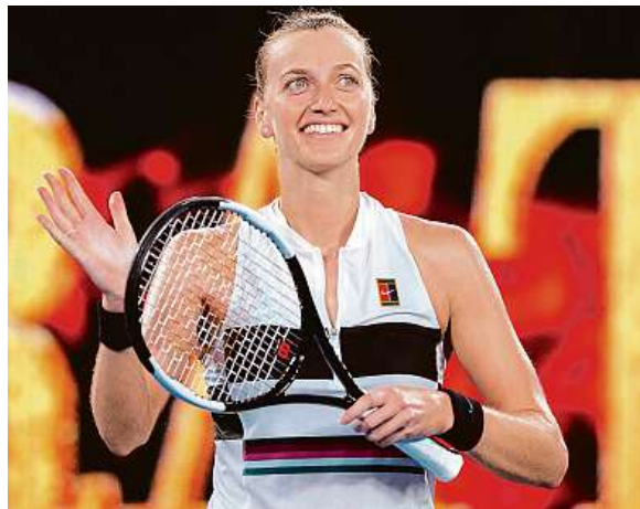
Petra Kvitová sklídila ovoce zaplněného centrkurtu.

Další rychlé vítěství. Kvitová po 70 minutách na kurtu postupuje do semifinále Australian Open.