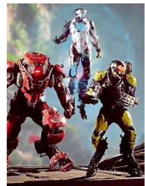
Očekávaná herní pecka

Standardní edici hry Anthem v Mironetu pořídit za 1399 korun pro PC a za 1599 korun pro konzole. Speciální edice Anthem Legion of Dawn Edition pak může být vaše za 2199 korun. Oficiální vydání hry nastane 22. února.