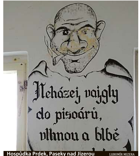
Hospůdka Prdek, Paseky nad Jizerou