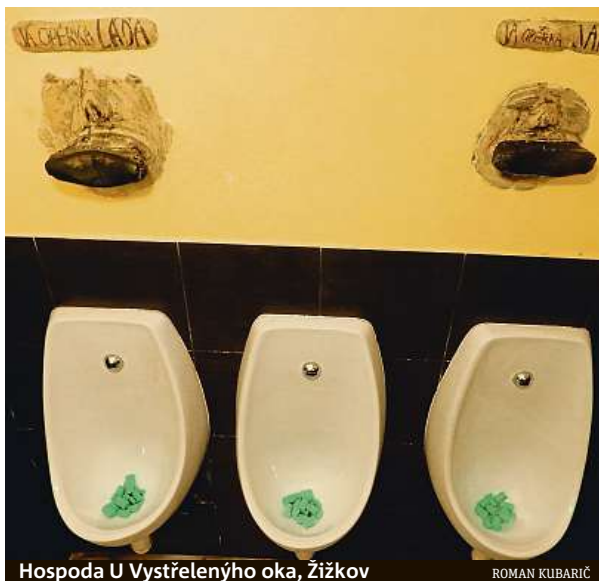
Hospoda U Vystřeleného oka, Žižkov