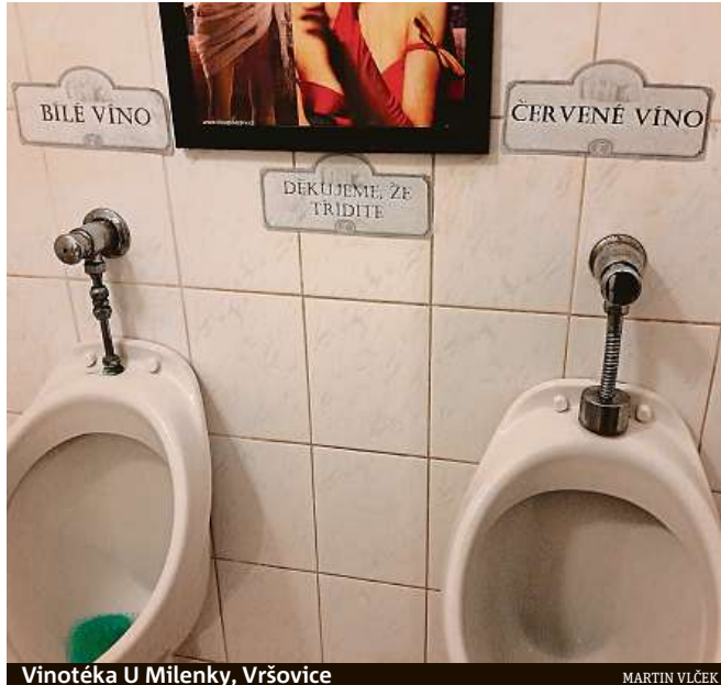
Vinotéka U Milenky, Vršovice

Na neobvyklé toalety narážejí čtenáři Metro docela často. K takovému závěru jsme v redakci došli poté, co jsme si prohlédli desítky čtenářských fotografií, které jste nám na toto téma zaslali. Fotografické výzvy se tentokrát chopili tak poutivě, že k nám dorazily nejen obrázky pořízené v tuzemsku, ale i v zahraničí. Protože jsme však ve výzvě přislíbili otisknout nejzajímavější snímky toalet, které byly pořízeny ve vašem okolí, těmi zahraničními se můžete pokochat alespoň na našem webu www.metro.cz . MET