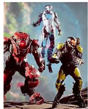
Očekávaná herní pecka

Standardní edici hry Anthem v Mironetu poříďte za 1399 korun pro PC a za 1599 korun pro konzole. Speciální edice Anthem Legion of Dawn Edition pak může být vaše za 2199 korun. Oficiální vydání hry nastane 22. února.