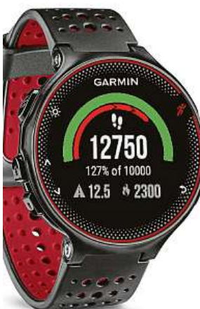
Síkovný pomocník 2xMIRONET

Garmin je ve světě elektroniky známá spíše díky GPS navigacím. Léta se ale také pohybuje na poli chytrých hodinek, kam nyní přibyl model Garmin Forerunner 235 Optic. Už na první pohled poznáte, že jde o příslušenství navržené pro aktivní použití při sportu. Tělo hodinek není komplikované. Je hlavně