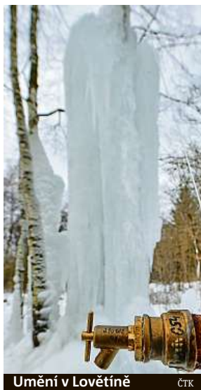
Umění v Lovětíně

Incident se stal loni 21. dubna u obchodního centra Quadrio. Číšník skupinu sedmi mužů upozornil, že na zahrádce restaurace nemohou popíjet vlastní alkohol, což muže popudilo. Útočníci napadeného povalili na zem, začali ho bít pěstmi a kopali do něj. Když zůstal bezvládně ležet na zemi, z místa utekli.