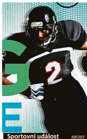
Sportovní událost ARCHIV

V rámci speciálního Big Game Menu budou k dispozici i křídýlka, Chips & Salsa, Chilli Hot Dogs, Southwest Flatbread, Jalapenos Popper, či mini burgery.