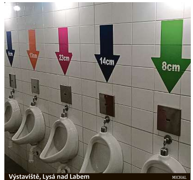
Výstaviště, Lysá nad Labem