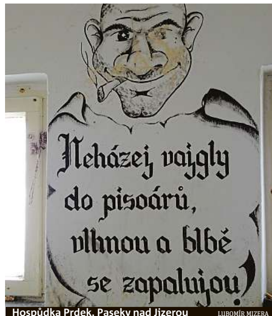
Hospůdka Prdek, Paseky nad Jizerou