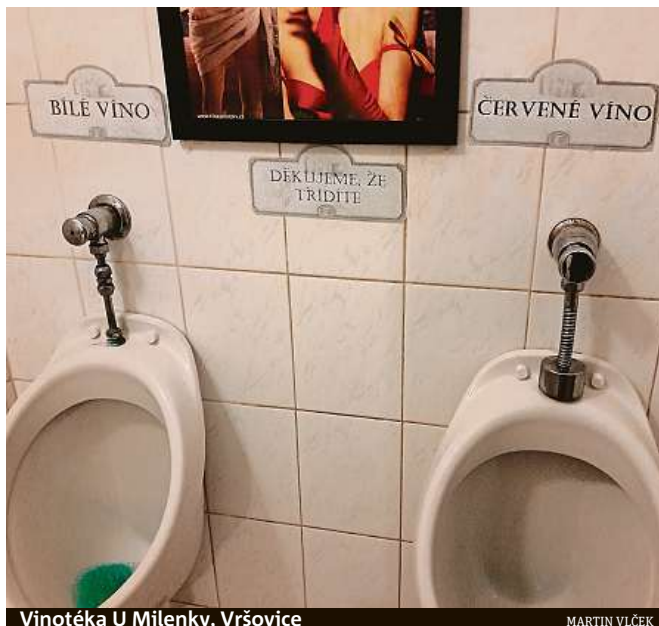
Vinotéka U Milenky, Vršovice

Na neobvyklé toalety narážejí čtenáři Metra docela často. K takovému závěru jsme v redakci došli poté, co jsme si prohlédli desítky čtenářských fotografií, které jste nám na toto téma zaslali. Fotografické výzvy se tentokrát chopili tak poutivě, že k nám dorazily nejen obrázky pořízené v tuzemsku, ale i v zahraničí. Protože jsme však ve výzvě přislíbili otisknout nejzajímavější snímky toalet, které byly pořízeny ve vašem okolí, těmi zahraničními se můžete pochovat alespoň na našem webu www.metro.cz . MET