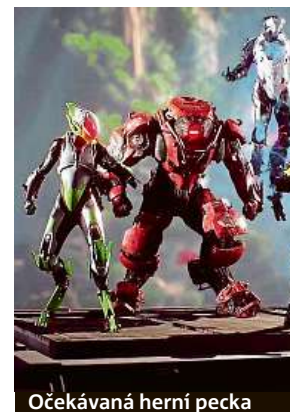
Očekávaná herní pecka

Standardní edici hry Anthem v Mironetu poříďte za 1399 korun pro PC a za 1599 korun pro konzole. Speciální edice Anthem Legion of Dawn Edition pak může být vaše za 2199 korun. Oficiální vydání hry nastane 22. února.