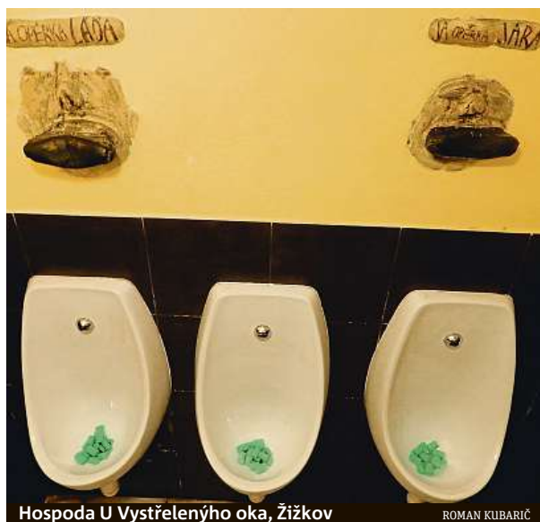
Hospoda U Vystřeleného oka, Žižkov