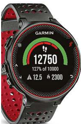
Síkovný pomocník 2xMIRONET

Jak vám chytrá nositelná elektronika může pomoci k lepším sportovním výkonům? Praxe ukazuje, že chytré příslušenství skutečně dokáže motivovat uživatele, dokáže změřit jeho úspěchy a také je vizualizovat. Jedním z nejoblíbenějších nositelných doplňků jsou sportovní chytré hodinky.