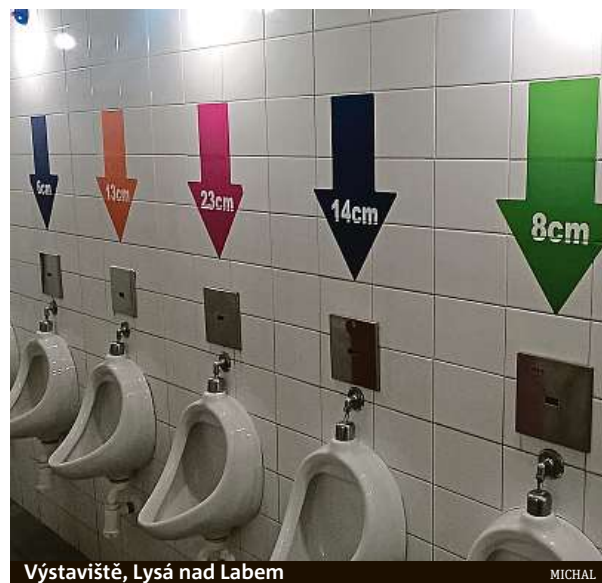
Výstaviště, Lysá nad Labem