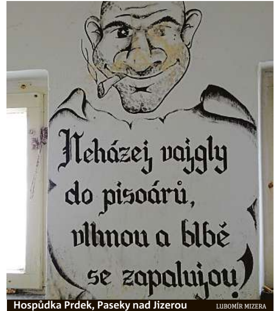
Hospůdka Prdek, Paseky nad Jizerou