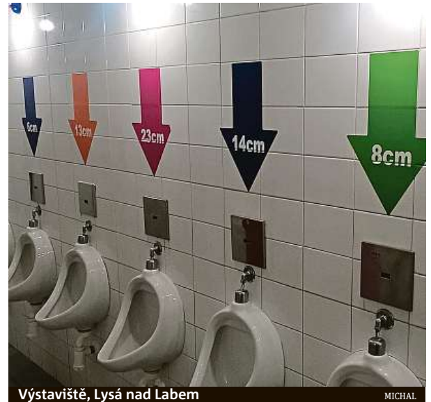
Výstaviště, Lysá nad Labem