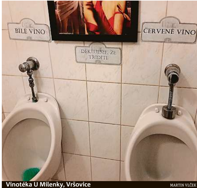
Vinotéka U Milenky, Vršovice

Na neobvyklé toalety narážejí čtenáři Metra docela často. K takovému závěru jsme v redakci došli poté, co jsme si prohlédli desítky čtenářských fotografií, které jste nám na toto téma zaslali. Fotografické výzvy se tentokrát chopili tak poutivě, že k nám dorazily nejen obrázky pořízené v tuzemsku, ale i v zahraničí. Protože jsme však ve výzvě přislíbili otisknout nejzajímavější snímky toalet, které byly pořízeny ve vašem okolí, těmi zahraničními se můžete pochovat alespoň na našem webu www.metro.cz . MET