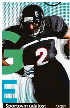
Sportovní událost ARCHIV

V rámci speciálního Big Game Menu budou k dispozici i křídýlka, Chips & Salsa, Chilli Hot Dogs, Southwest Flatbread, Jalapenos Popper, či mini burgery.