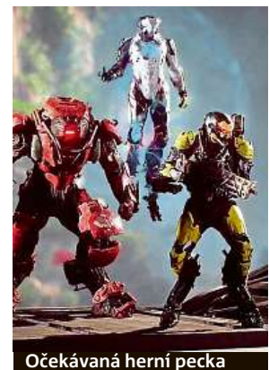
Očekávaná herní pecka

Standardní edici hry Anthem v Mironetu pořídit za 1399 korun pro PC a za 1599 korun pro konzole. Speciální edice Anthem Legion of Dawn Edition pak může být vaše za 2199 korun. Oficiální vydání hry nastane 22. února.