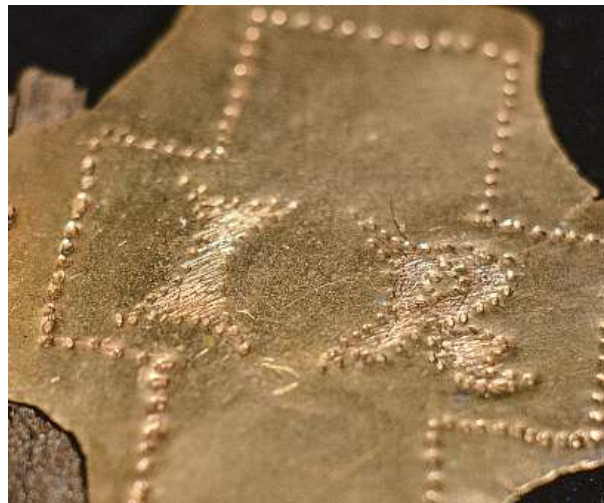
Jedna z nejvýznamnějších křesťanských relikvií. V trezorové místnosti kláštera našli část hřebu z Ježíšova kříže a také masivní zlatý plech s písmeny IR.

Milevsko by se mohlo zapsat do světové archeologie. V tamním klášteře byl nalezen nejspíš hřeb, na kterém zemřel Ježíš Kristus.