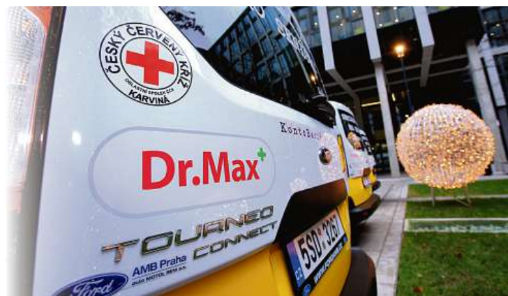
Nové vozy začnou sloužit v dalších třech regionech seniorům po Novém roce.