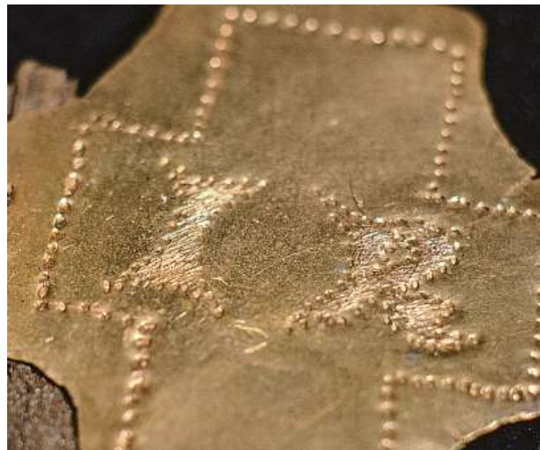
Jedna z nejvýznamnějších křesťanských relikvií. V trezorové místnosti kláštera našli část hřebu z Ježíšova kříže a také masivní zlatý plech s písmeny IR.

Milevsko by se mohlo zapsat do světové archeologie. V tamním klášteře byl nalezen nejspíš hřeb, na kterém zemřel Ježíš Kristus.