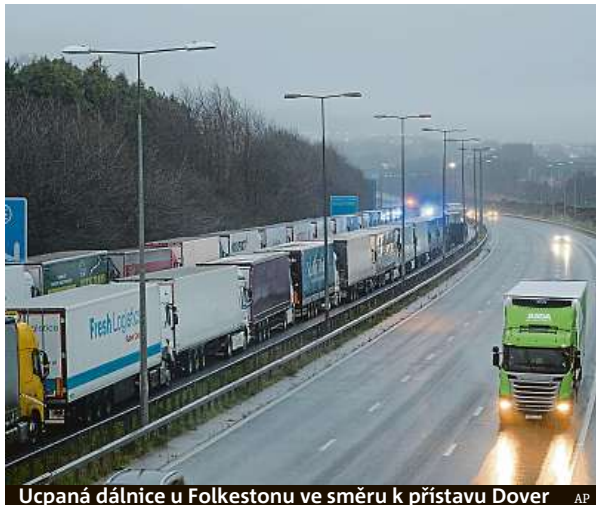
Ucpaná dálnice u Folkestonu ve směru k přístavu Dover

Cestování z Británie omezily také Chorvatsko, Hong-