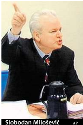
Slobodan Milošević

Jednalo se o první orgán svého druhu od dob Norimberského a Tokijského tribunálu, které byly zřízeny po druhé světové válce. Justici jednotlivých exjugoslávských republik bylo předáno 13 kauz. Zbýlé dvě čeká obnovený proces u Mechanismu OSN pro