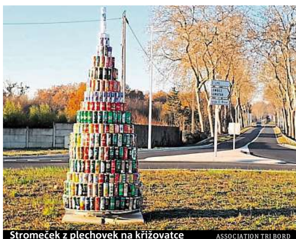
Stromeček z plechovek na křižovatce