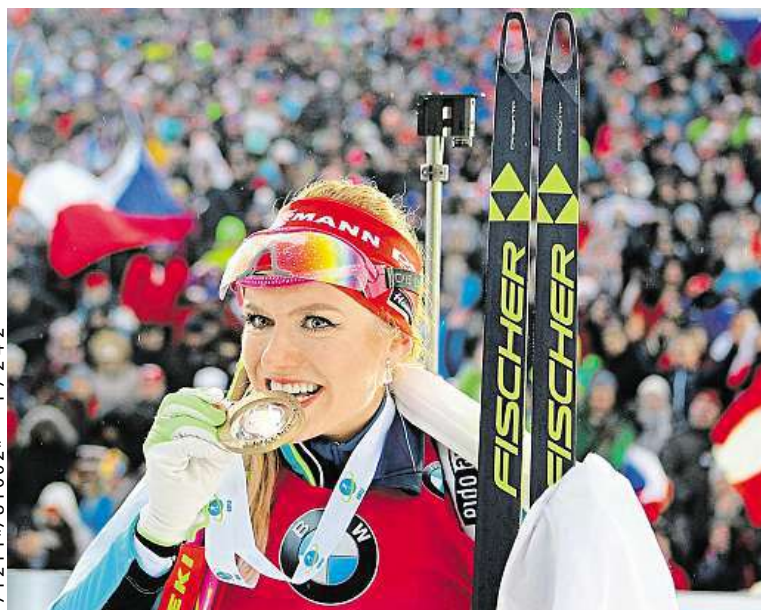
Sportovcem roku 2017 je biatlonistka Gabriela Koukalová. Více strana 17