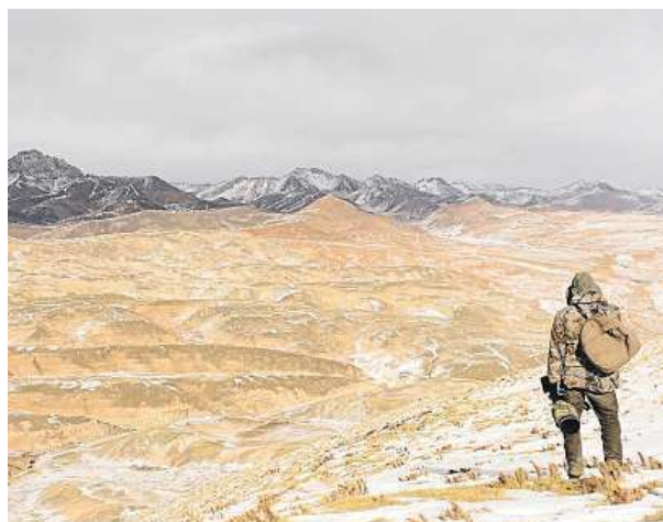
Pohled na typickou krajinu Tibetské náhorní plošiny