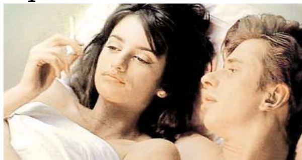
Penélope Cruzová ve filmu Láska vážně škodí zdraví LA PELÍCULA

Festival proběhne od 13. do 18. února již v prostorách pražského kina Světozor. Následovat budou Ostrava, Hradec Králové a Brno. Více na webu www.lapelicula.cz . MET