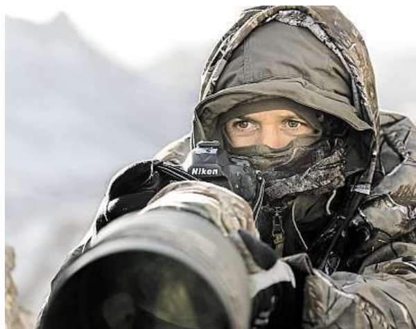
Trpělivost je klíčem k úspěchu.