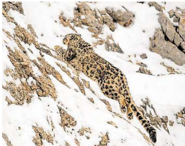
„Jako by se nad kameny vznášel. Je děsně mrštný.“