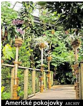
Americké pokojovky

Premýšlíte nad programem na sváteční dopoledne? Botanická zahrada hl. m. Prahy pro své návštěvníky připravila na Štědrý den vánoční dárek v podobě zvýhodněného vstupného do skleníku Fata Morgana za jednu korunu. Přeneste se na chvíli ze středoevropské zimy do tropického pralesa a projděte se vánočně vyzdobeným skleníkem, jako bonus uvidíte i výstavu Americké pokojovky. Otevřeno bude od 9 do 14 hodin. MET