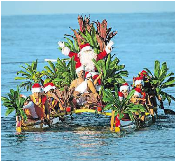
Příjezd Santa Clause na Havaji

Lidi na Islandě „straší“ lidožravá kočka, Ukrajinci si byty zdobí pavouky. V různých koutech světa se slaví Vánoce jinak.