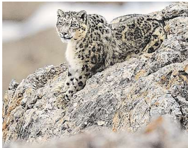
„Strávil jsem hodiny ve skrýši za skálou, abych snímek měl.“

Klíčové je zvířata respektovat a snažit se je nerušit – nejen pro jejich dobro, ale i pro vaše. Mohou být nebezpečná. Předmět svého zájmu studujte a naučte se něco o jeho zvycích a chování. O zvířatech si rád co nejvíce čtu a také se bavím s ostatními fotografy a cestovateli a učím se z jejich zkušeností. Při fotografování dbám na to, abych přírodní světelné podmínky využil ve svůj prospěch. Také doporučuji, abyste se přinutit dělat různorodé sady snímků. Nespoléhejte na to, že budete znovu a znovu pořizovat stejný záběr. Narazit na levharta sněžného je obrovské štěstí, takže potřebujete mít co nejlepší fotoaparát. HOP, MET