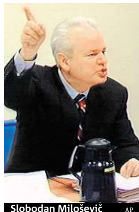
Slobodan Milošević

Soud se zabýval zločiny spáchanými na území bývalé Jugoslávie.