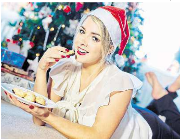
Vánoce jsou ve znamení přejídání.

V lednu se vše vrací k normálu a po dvou týdnech přejídání konečně můžeme začít jíst tak, aby naše tělo netrěpelo. Vracíme se do práce, děti do školy, máme jedinečnou příležitost nastavit našemu stravování pevný řád. „Pokud budeme jíst pravidelně a kvalitně, předejdeme požívání nezdravých, ale lehce dostupných pokrmů – takzvaných rychlokvám – jen abychom zahnal hlad, a různým malič-