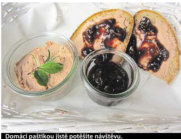
Domácí paštikou jistě potěšíte návštěvu.