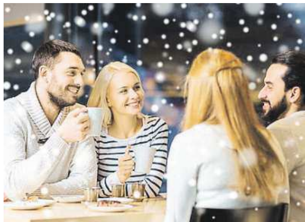
Friended stay together at Christmas.