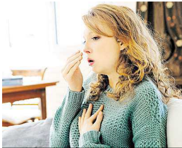
Kašlem tělo udržuje dýchací cesty průchozí.

Takzvaný subakutní kašel, tedy ten, který trvá tři až osm týdnů, může být příznakem zánětů vedlejších nosních dutin, zadní rýmy, černého kaš-