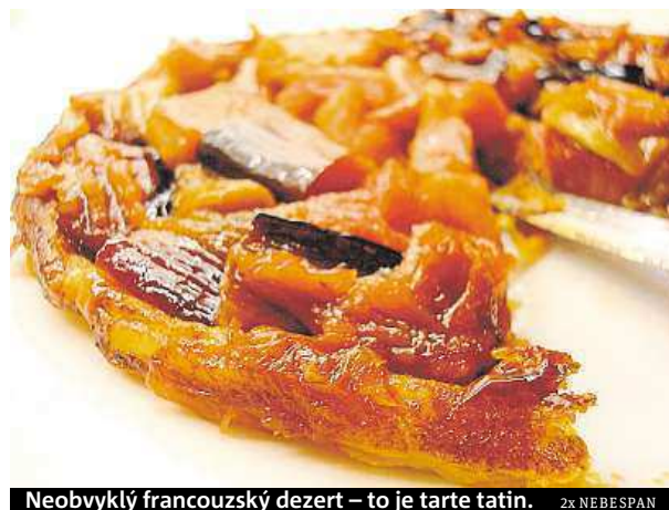
Neobvyklý francouzský dezert – to je tarte tatin. 2x NEBESPAN

přidáme kmín a pořádně zamícháme. Směs dáme přiklopnou péct při 170 stupních na asi 45 minut. Občas zamícháme. Do upečené směsi přidáme rozpuštěné máslo a mixujeme do jemné konzistence. Přidáme čerstvě nasekané bylinky, popřípadě dochuťme solí a pepřem a dáme chladit ve formě do chladničky zhruba na tři hodiny.