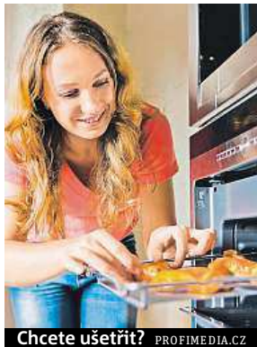
Chcete ušetřit?