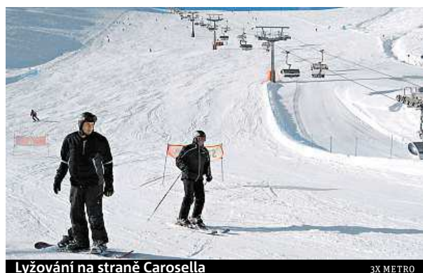
Lyžování na straně Carosella