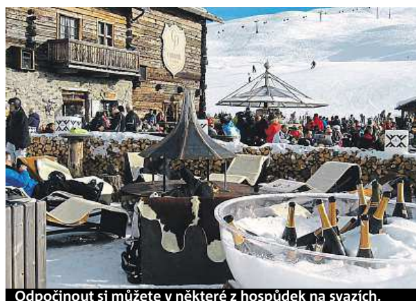
Odpočinout si můžete v některé z hospůdek na svazích.