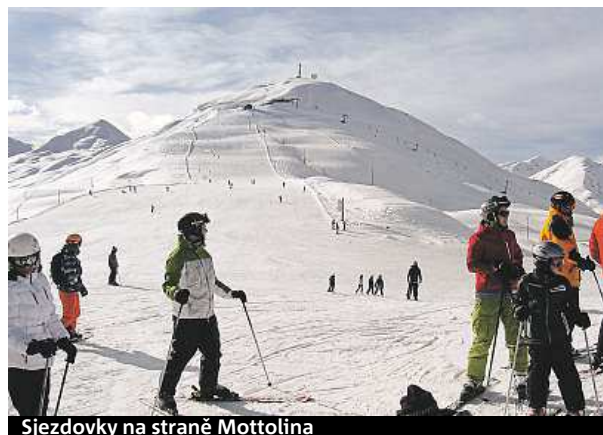
Sjezdovky na straně Mottolina