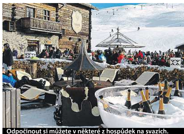
Odpočinout si můžete v některé z hospůdek na svazích.