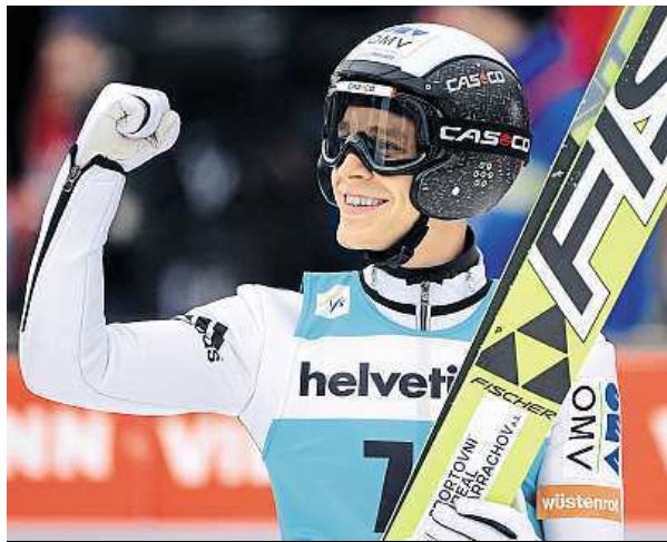
Koudelka slaví své třetí vítězství v sezoně i v kariéře.

Za Koudelkou byl druhý domácí závodník Simon Ammann, který s českým skokanem prohrál o 5,2 bodu. Koudelka předvedl v prvním kole skok dlouhý 135,5 metru