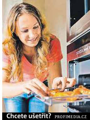
Chcete ušetřit?