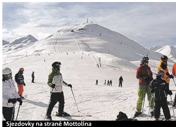
Sjezdovky na straně Mottolina