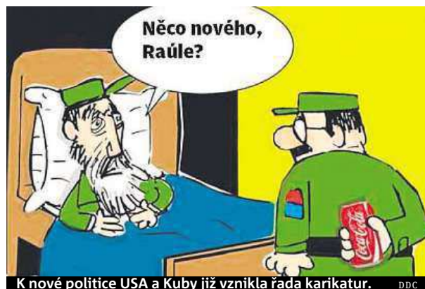
K nové politice USA a Kubu již vznikla řada karikatur. DDC

Americký prezident v rozhovoru pro CNN odmítl kritiku těch, kteří ho obviňují z ustupování diktaturám. Navázání vztahů s Kubou není podle Obamy ústupek, ale šance. „Je to šance pro Washington ovlivnit dění na tomto ostrově v době očekávané generální obměny ve vedení země,“ řekl Obama. Nyní 88letý Fidel Castro na ostrově vládl od roku 1959 do roku 2006, kdy kvůli zdravotním potížím předal otěže moci svému bratru Raúlovi. Tomu