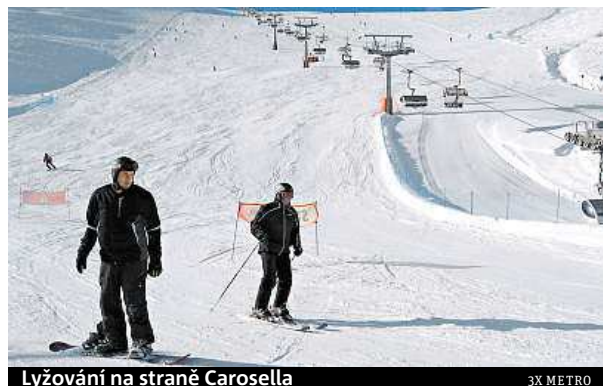
Lyžování na straně Carosella