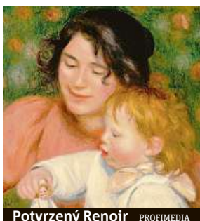
Potvrzený Renoir

„Odborníci se více než století přeli o to, zda je autorem díla ve vlastnictví soukromého švýcarského sběratele skutečně věhlasný francouzský impresionista nebo jiný umě-