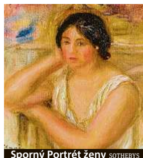
Sporný Portrét ženy SOTHEBYS

Inkriminovaného plátna z roku 1915 se ujala švýcarská společnost Art Recognition, jež použila svůj robotický algoritmus, který načel a zaznamenal 206 reprodukcí Renoirových maleb, aby se naučil rozpoznat malířův styl. Ten podle odborníků charakterizují trhané tahy štětcem a výrazné kombinace kontrastních barev. „Algoritmus měl také k dispozici menší výřezy z Renoirových děl a malby jiných umělců, kteří tvořili v podobném