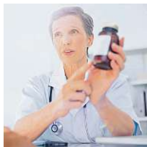
Dbejte rad lékaře.

Pokud se nezmění naše postoje k antibiotikům, tak podle Státního zdravotního