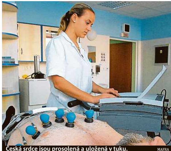
Česká srdce jsou prosolená a uložena v tuku.