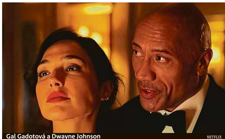
Gal Gadotová a Dwayne Johnson

Hvězdy, dvě stě milionů babek a máte hit? To vždycky nestačí.