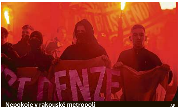
Nepokoje v rakouské metropoli AP

Rakousko zavedlo už minulý týden lockdown pro neoč-