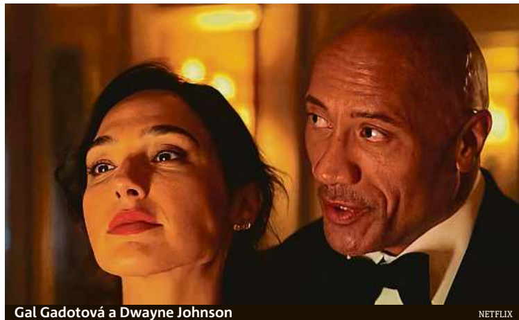
Gal Gadotová a Dwayne Johnson

Hvězdy, dvě stě milionů babek a máte hit? To vždycky nestačí.