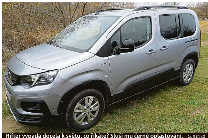
Rifter vypadá docela k světu, co říkáte? Sluší mu černé oplastování. 2x METRO