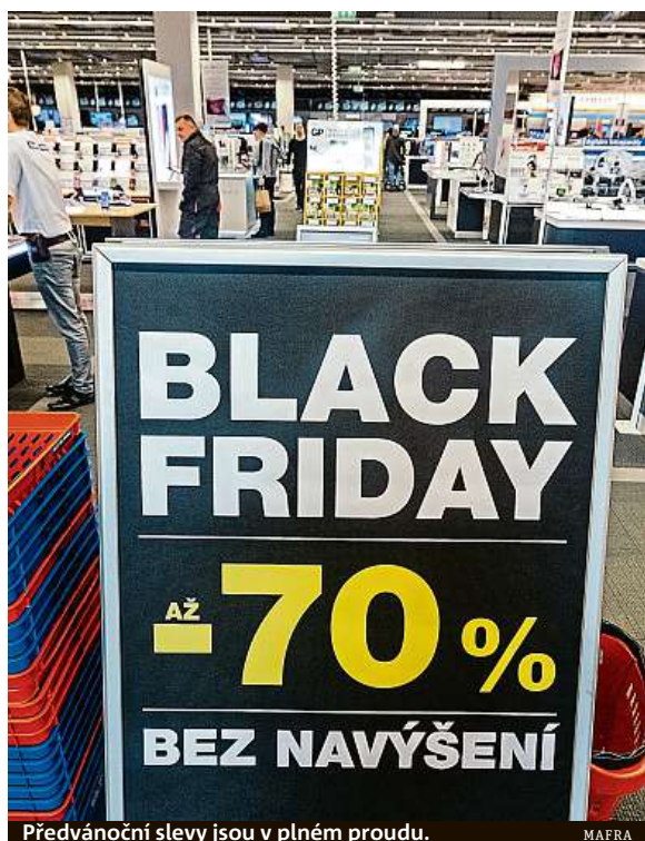
Předvánoční slevy jsou v plném proudu.