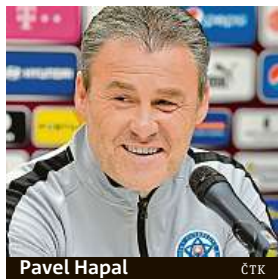
Pavel Hapal

Fotbalový rebel dal sbohem slovenské reprezentaci.