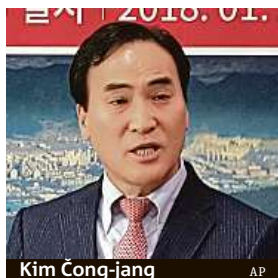
Kim Čong-jang

Kim Čong-jang působil jako úřadující šéf mezinárodní policejní organizace po rezignaci Číňana Meng Chung-weje vyšetřovaného nyní ve své zemi kvůli podezření z přijímání úplatků a z porušení zákona.