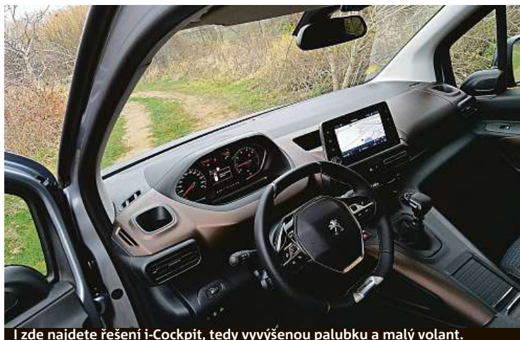
I zde najdete řešení i-Cockpit, tedy vyvýšenou palubku a malý volant.

Námi testovaný vznětový jedenapůllitrový motor s výkonem 130 koní se k autu ideálně hodí, je tichý a úsporný. Sportovní chování ale od MPV nečekejte. Spotřeba během testu – šest litrů na sto. Cena auta startuje po akční slevě na zajímavé částce 385 tisíc korun. PETR HOLEČEK