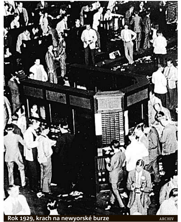
Rok 1929, krach na newyorské burze