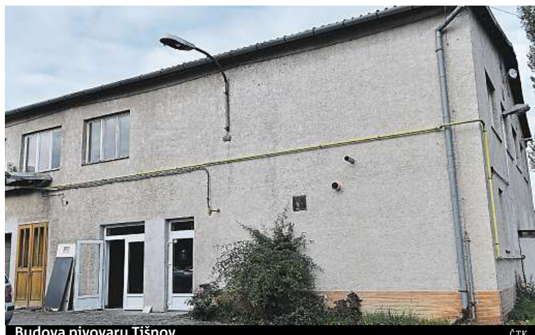
Budova pivovaru Tišnov ČTK

místní obyvatelé pravidelně dopřávat,“ uvedl Polák. Konkurenci tišnovských minipivovarů už pociťuje i tradiční značka Kvasar z blízkých Sentic. Rodina Veselých doma vařila 25 let, nyní se přesouvá v rámci obce na jiné místo, kde má nové prostory. Růst odbytu ale nečeká, také vzhledem ke konkurenci. ČTK