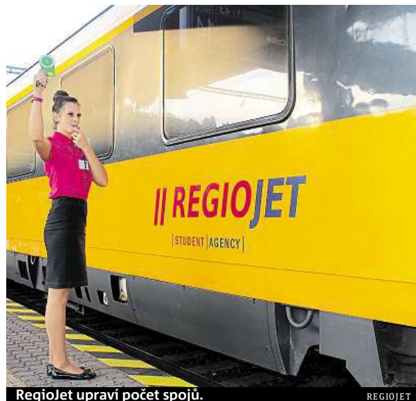
RegioJet upraví počet spojů.

Zato České dráhy s platností nových jízdních řádů změnu ceníků teprve připravují. Konkrétní podobu hodlají zveřejnit v nejbližších dnech, podrobnosti o změnách v regionálním jízdním řádu prozradí už tradičně až