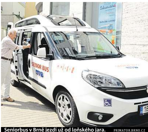
Seniorbus v Brně jezdí už od loňského jara.

Služba zajišťuje přepravu seniorům a tělesně postiženým například k lékaři nebo na úřady.