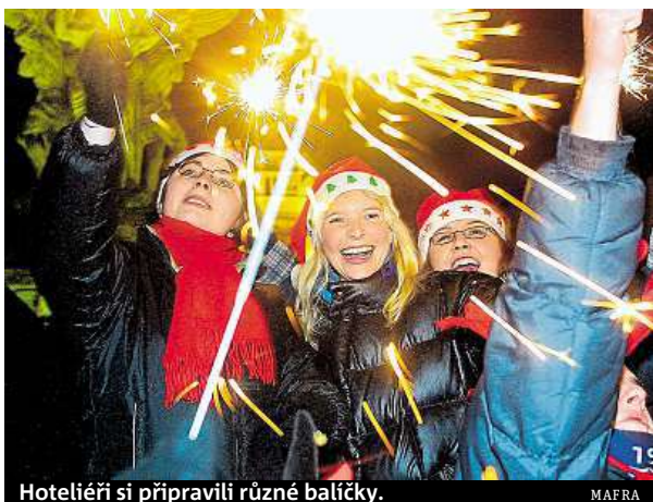
Hoteliéři si připravili různé balíčky.

„Zájem přijet k Punkevním jeskyním byl letos tak velký, že jsme jednu skupinu už zahraničních turistů museli přeměňovat do Brna. Takže