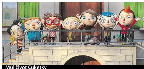
Můj život Cuketky

Vstupenky lze koupit na webu kinoscala.cz či v pokladně kina. RADEK BABIČKA