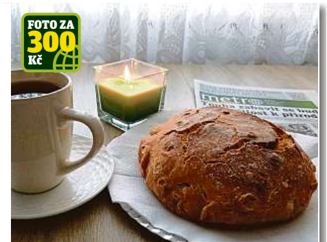
FOTO ZA 300 Kč Odpolední siesta v podání Jaroslavy Pitarové: zapálit svíčku, uvařit oblíbený čaj, nakrojit domácí chléb a zakusnout se vedle něj i do nového vydání Metra.