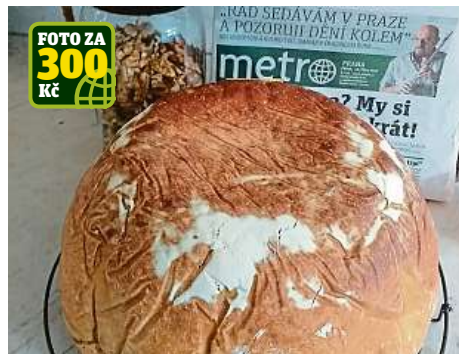
FOTO ZA 300 Kč Skrývají se v tomto krásném bochníku domácího chleba od čtenářky Zuzany Svobodové ořechy? Možná, uvidíme, až ochutnáme. Moment! Už nic nezbylo...