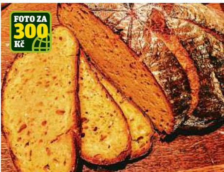
FOTO ZA 300 Kč Namazat máslem, lehce posolit a zasypat ještě třeba nasekanými bylinkami. Domácí výtvar čtenářky Milušky Coufalové je doslova k sežrání. Promiňte ten výraz.