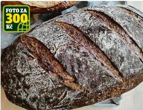
FOTO ZA 300 Kč Upečte s Metrem chleba a dostanete 300 korun na mouku, zněla naše fotovýzva. Přišlo plno chlebů, děkujeme! Za tento dostane odměnu Anna Kramolišová.