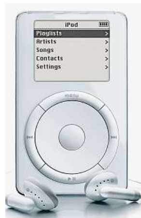
iPod z roku 2001

I přes poměrně vysokou prodejní cenu 399 dolarů se iPod trefil do černého. Hraniční jednoho milionu prodaných kusů iPod překonal už v červnu 2003. Ve stejném roce firma Apple představila svoji placenou internetovou službu na stahování hudby iTunes. ČTK