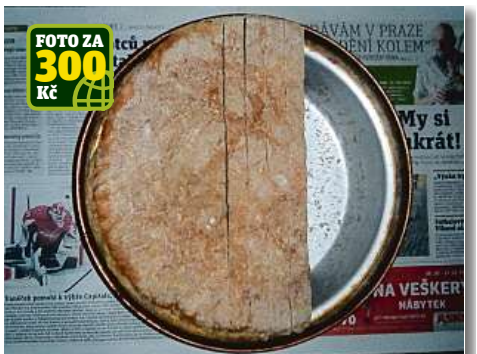
FOTO ZA 300 Kč Že není pečení chleba jen ženskou záležitostí, dokazuje Milan Vybíral z Olomouce, který posvačil nad vydáním Metra. Tak snad tam nebylo moc špatných zpráv.