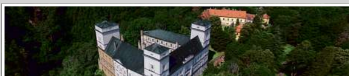
Zastavovaný areál zámku Račice v rámci dluhopisového programu e-Finance CZ v celkové hodnotě uveřejněné na adrese www.e-finance.eu/zajistene-dluhopisy .

Koncern e-Finance, a.s. v současnosti spravuje investice do nemovitostí v hodnotě přesahující 1 miliardu korun. Investiční strategií e-Finance je investovat prostředky získané z dluhopisů do nákupu a výstavby rezidenčních a komerčních nemovitostí v atraktivních lokalitách České republiky. Portfolio investic najdete na www.e-finance.eu .