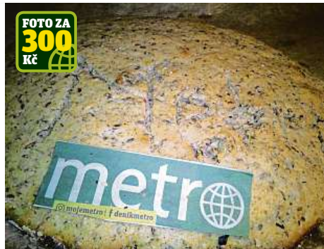
FOTO ZA 300 Kč Čtenářka Jana Hoslová upekla chleba přímo pro redakci Metra! Aby nám jej nikdo neukradl, je bezpečnostně opatřen přímo názvem našich novin. Díky!