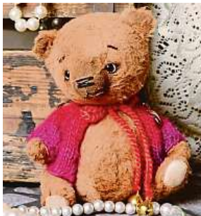
Jedni z mnoha účastníků mezinárodní výstavy ručně šitých medvídků

Návštěvníci budou moci medvídky koupit přímo od jejich autorek a autorů, vylosovat nejkrásnějšího medvídku