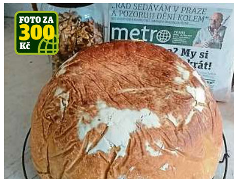
FOTO ZA 300 Kč Skrývají se v tomto krásném bochníku domácího chleba od čtenářky Zuzany Svobodové ořechy? Možná, uvidíme, až ochutnáme. Moment! Už nic nezbylo...