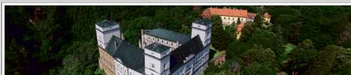
Zastavovaný areál zámku Račice v rámci dluhopisového programu e-Finance CZ v celkové hodnotě uveřejněné na adrese www.e-finance.eu/zajistene-dluhopisy .

Koncern e-Finance, a.s. v současnosti spravuje investice do nemovitostí v hodnotě přesahující 1 miliardu korun. Investiční strategií e-Finance je investovat prostředky získané z dluhopisů do nákupu a výstavby rezidenčních a komerčních nemovitostí v atraktivních lokalitách České republiky. Portfolio investic najdete na www.e-finance.eu .