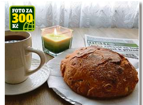
FOTO ZA 300 Kč Odpolední siesta v podání Jaroslavy Pitarové: zapálit svíčku, uvařit oblíbený čaj, nakrojit domácí chléb a zakusnout se vedle něj i do nového vydání Metra.