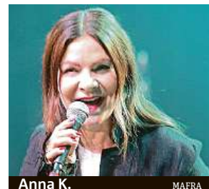
Anna K.