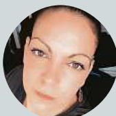
Len Ka Jasně. Minulý víkend jsem koukala na Pardubickou.