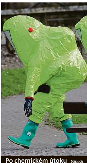
Po chemickém útoku

„Náš nanostrukturální oxid titaničitý dokáže rozkládat škodliviny typu bojových látek díky svým unikátním povrchovým vlastnostem a ješ-