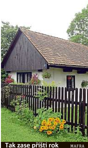
Tak zase příští rok MAFRA

Tisíckrát omílané téma, a stále děláme chyby. Na co si musíme dát pozor, když opouštíme chatu nebo chalupu, do které se vrátíme až na jaře? „Setkali jsme se s případy, kdy majitel chaty na podzim jen zavřel okenice a zamkl vchod. To považoval za dostatečné, a přitom neprovedl žádné zabezpečení vodovodu a odpadu, nevyplnil elektrinu a vůbec nevěnoval pozornost bezpečnostním opatřením před případnými zloději. Takových případů je bohužel mnoho, a proto věnujeme tolik úsilí upozorňování na nutnost dobrého zazimování nemovitosti a osvětě v otázce bezpečnosti chat a chalup