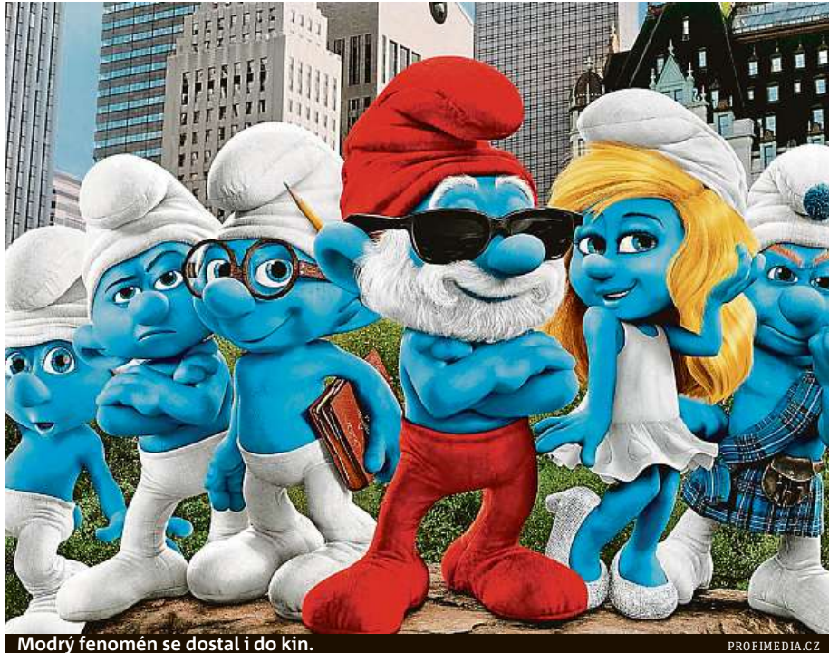
Modří fenomén se dostal i do kin.

Modří skřítkci byli původně vedlejší postavy jiného komiksu. Přesto dostali šanci na své příběhy a stali se slavnými.